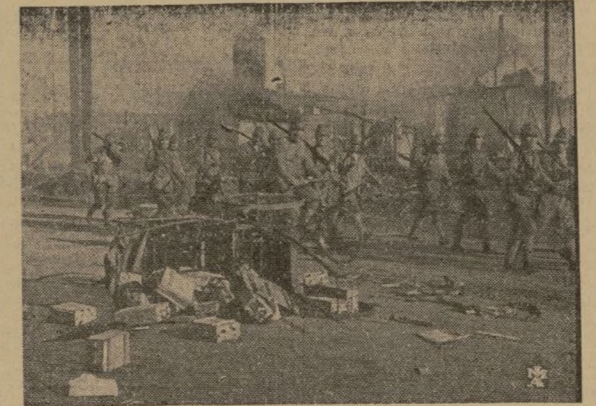
NANKIN.—Entre las ruinas humeantes de un barrio, un destacamento japonés desfila ante el cráter de un chino asesinado

Redirigiéndose después a los problemas de la política interior china, el señor Chen-Li-Fu declaró que el problema comunista no existe en China ya que los comunistas chinos actúan unidos al Kuomintang. En estas condiciones los comunistas —dijo— pueden participar en los negocios de Estado en igualdad de condiciones que los demás ciudadanos chinos.