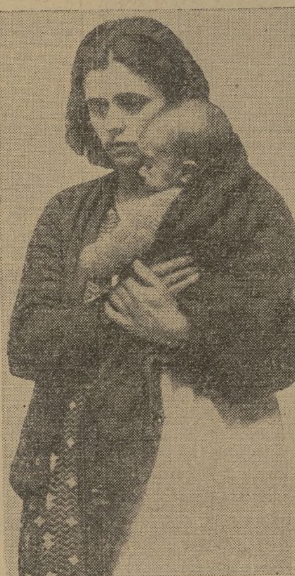
«Había que huir. Abandonarlo todo. El vendaval se acercaba...»

Y sigue la caravana, a pesar de la inclemencia del tiempo, del frío, de la lluvia, sigue la caravana. Rosario lleva hielo en el alma.