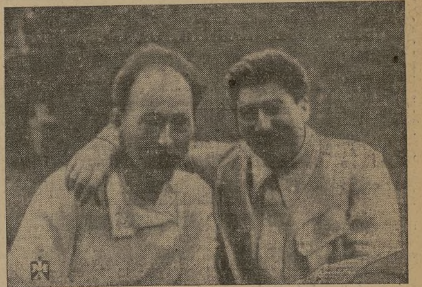
El XX aniversario de la fundación de la Tcheka, G. P. U.—Stalin y Dzerzhinski, organizador del primer servicio de defensa contra el espionaje y el terrorismo contrarrevolucionario en 1921.

«La academia de los dictadores. Curso en cuatro lecciones.»