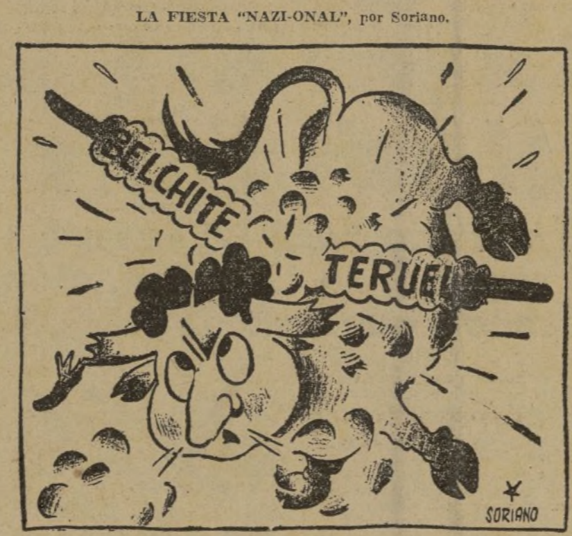
Banderillas de fuego... ¡Por manso!

El mencionado banquero ha ingresado inmediatamente en la cárcel.—Fabra.