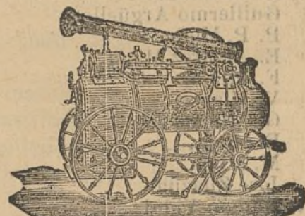
Máquina de vapor. Locomóvil.

Catálogos gratis y francos á quien los pida.