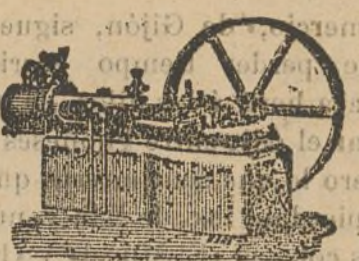
Máquina de vapor horizontal.