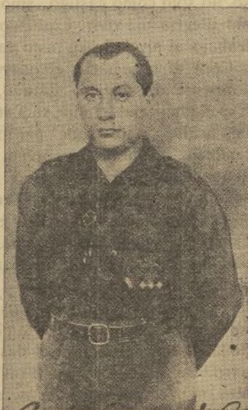
J. ANTONIO PRIMO DE RIVERA; este fué el nombre que estuvo en los labios de todos los oradores, y en el corazón de todos los oyentes.

ensalzar la labor de nuestra marina nacional. Canto epopéyico a nuestros bravos marinos que saben hacerse dignos de España y de la Falange.