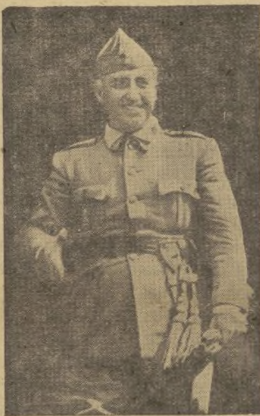
EL JEFE DE ESTADO

El hombre que con su amor a la Patria supo, de una juventud envenenada del virus internacionalista, le-