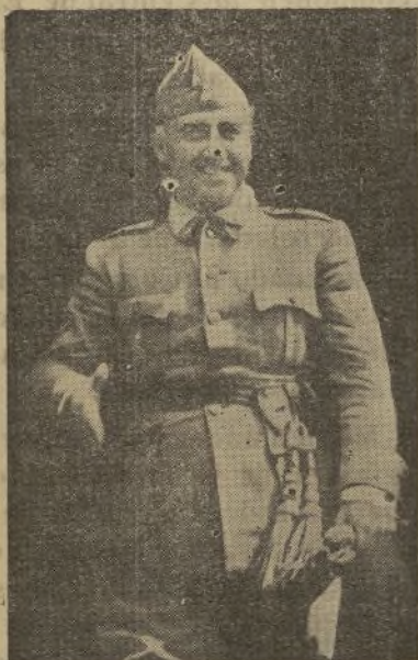
EL JEFE DE ESTADO

El hombre de guerra, el héroe militar, pasa luego al campo de la cultura organizada, a dirigir la Academia Militar. La práctica, la realización, se había adelantado en él a las teorías; lleva en sí mismo el modelo militar y no le cuesta gran trabajo, ni mucho tiempo, formar a su imagen y semejanza un lucido plantel de oficiales.