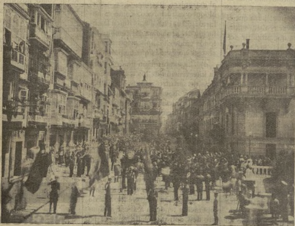
MOMENTO DE LA LLEGADA DE LA GRAN MANIFESTACIÓN SINDICAL DEL 18 DE JULIO, ANTE EL PALACIO DE CAPITANÍA.

Texto íntegro de la petición elevada por la C. O. N. S. al Excmo. Sr. Comandante General del Departamento Marítimo de Ferrol, pidiendo amnistía para los obreros afectados por el Decreto 108