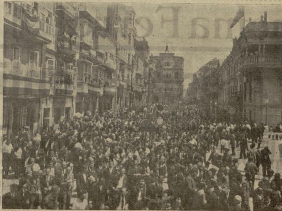
MOMENTO EN QUE EL EXCMO. SR. COMANDANTE GENERAL MILITAR DEL DEPARTAMENTO MARÍTIMO DIRIGE LA PALABRA A LOS MANIFESTANTES.

No es una amnistía lo que solicitamos, es la apreciación de un principio de pura lógica. La causa del despido fué las actividades políticas o sociales peligrosas; el efecto, el despido.