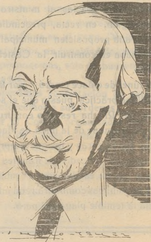
Don ALEJANDRO LERROUX

La actitud resuelta del Señor Cid ante la indisciplina de algunos funcionarios nos parece ejemplar. El interés nacional y el de las clases medias es que ningún sindicato o agrupación de profesionales puedan ejercer una Dictadura abusiva en ningún aspecto de la administración pública. Por eso la actitud del señor Cid ha recibido el aval de la opinión, que ha visto con agrado y simpatía la decisión de este gobernante, que sabe hermanar el sincero republicanismo con la obligada severidad del que se ve forzado a cortar de raíz una injustificada ingerencia de sus subordinados.