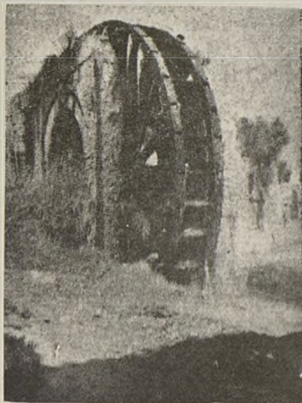
La tradicional rueda de La Ñora.

nada le falte a sus hermanos, los combatientes de vanguardia.