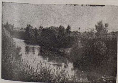
Las riberas del Segura.

Conozco mi tierra ; sé con el calor que me alientan los míos a seguir luchando en esta tragedia de dolor; porque saben lo que en ello va, la libertad que es la vida; así, ellos se aprestan con un trabajo callado y constante a reforzar el Ejército de la retaguardia, luchando a brazo partido con el duro suelo y arrancando de él las materias necesarias para conseguir un triunfo próximo y definitiva; ellos trabajan día y noche, sin descanso alguno, para multiplicar la producción para la guerra. Recuerdan aquellos días negros en que trabajaban de sol a sol, bajo la amenaza del señorito, del amo, del burgués que todo lo dedicaba a deglutir suculentos manjares y a vivir una vida de lujo y de holgazanería, y esto les hace aferrarse con más energía y ahínca a los ornos del trabajo y con su labor heroica y abnegada, procurar que