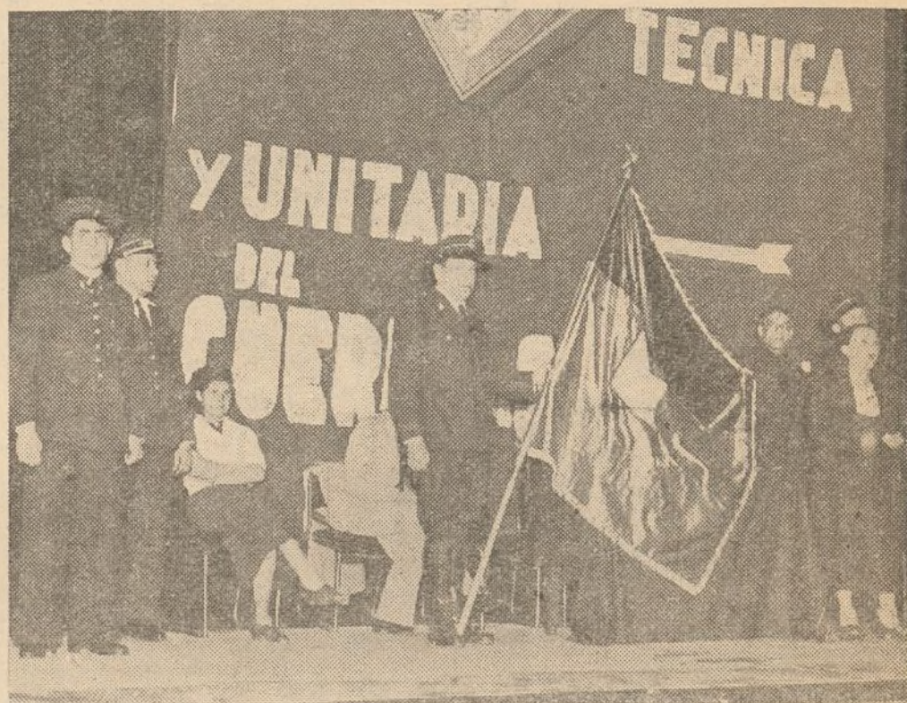
Ante los colores de la bandera republicana, símbolo de las libertades antifascistas, el Cuerpo de Seguridad ha hecho una promesa: luchar, luchar, luchar.

La capacitación en el Cuerpo de Seguridad debe ser la preocupa-