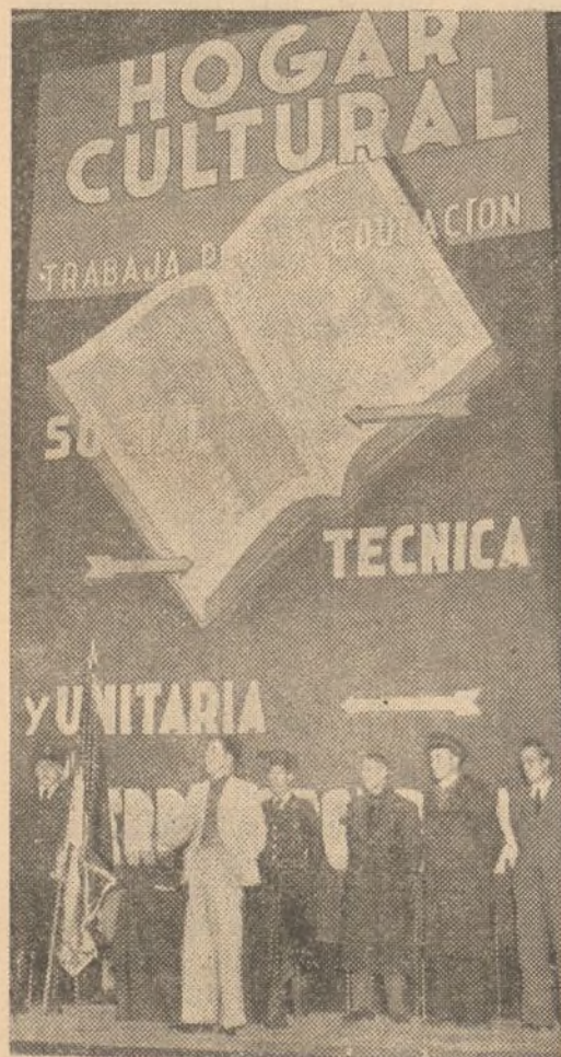
Acto-festival celebrado recientemente en el Cine Capitol con motivo de la entrega de una bandera al Hogar por los corresponsales de nuestro semanario