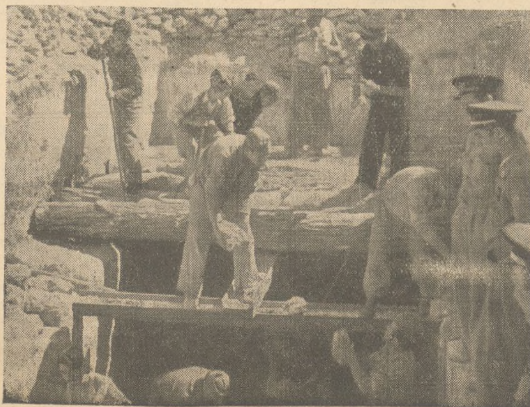
"FILM POPULAR" RODO UNA CINTA CINEMATOGRAFICA DE "ESPAÑA AL DIA", EN LOS FRENTE. UN DETALLE DE LA MISMA

importante obra, fueron recorridas por los visitantes, acompañados por el capitán jefe de talleres, ca-