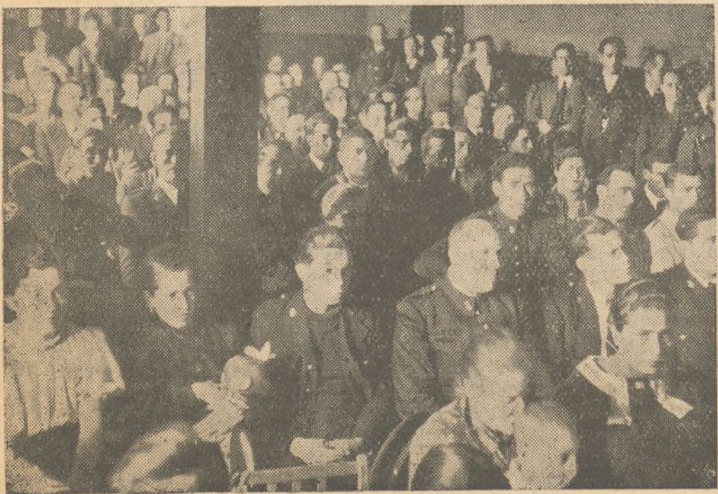
UN ASPECTO DEL SALON DE ACTOS EN LA INAUGURACION DEL HOGAR

Por la tarde se celebró un artístico festival.