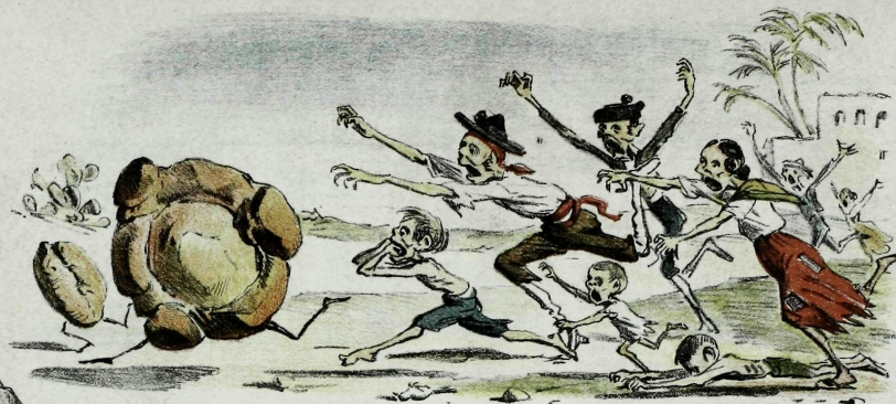
Corridas en Andalusia.