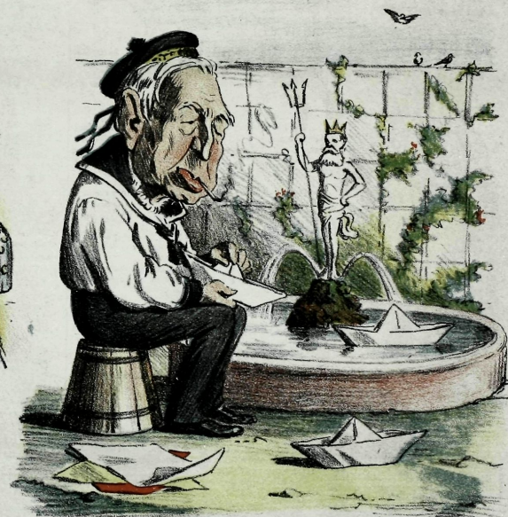
Pasatiempos de verano.