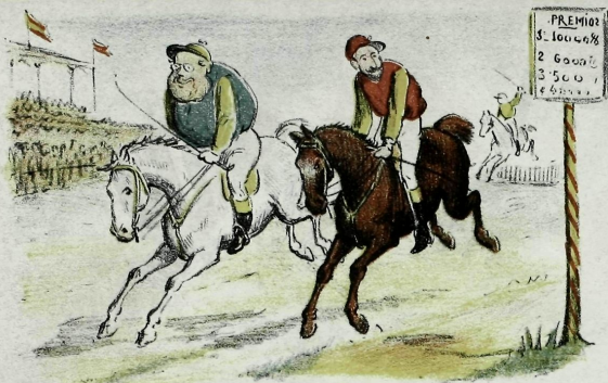
Corridas en el Hipódromo.