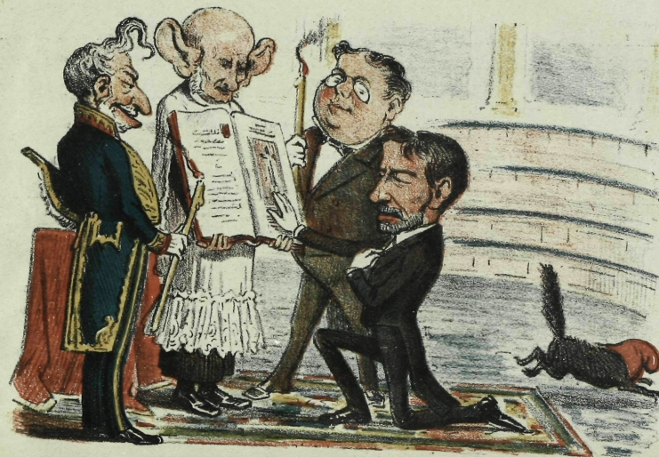
El Juramento-Zarzuela bufá