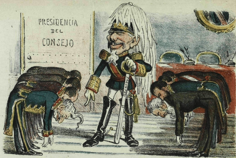
El Sultan del Ministerio y Ministro perpétuo.