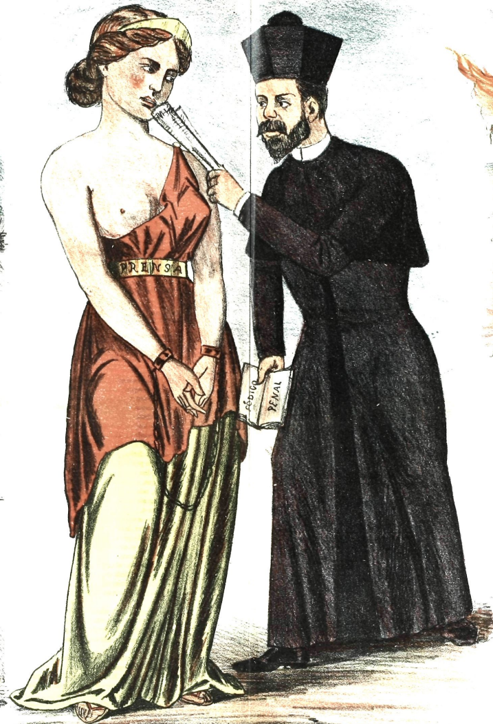
Comerse las palabras