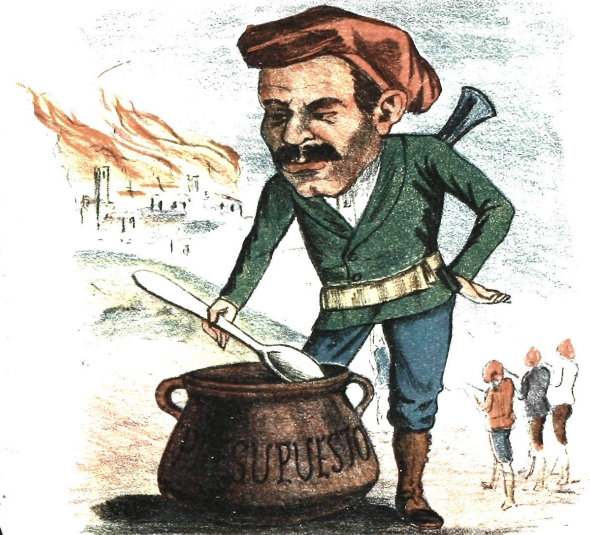
Comer y callar.