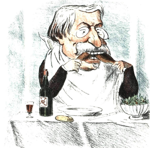
Comer a dos carrillos.