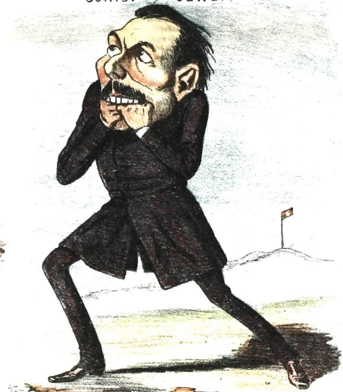
Comerse los puños