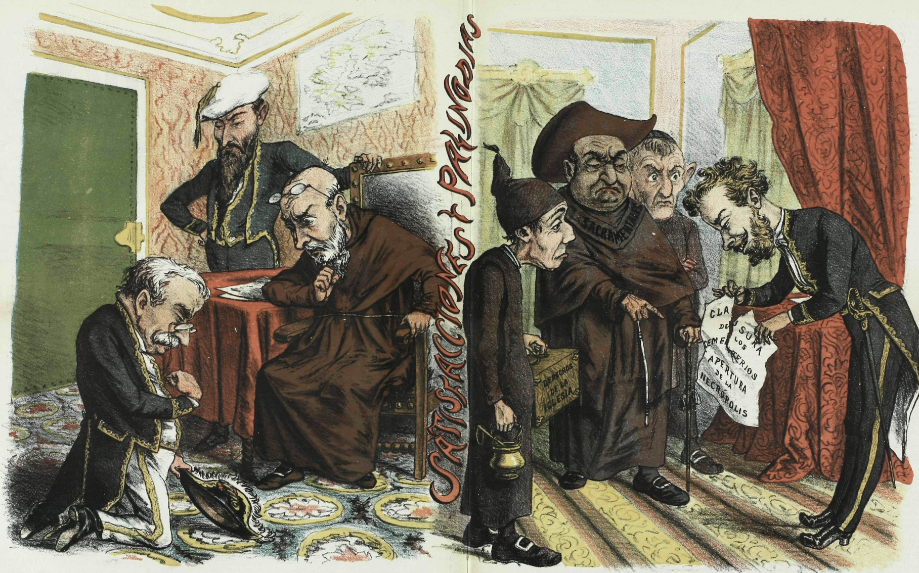
Lo de Italia .