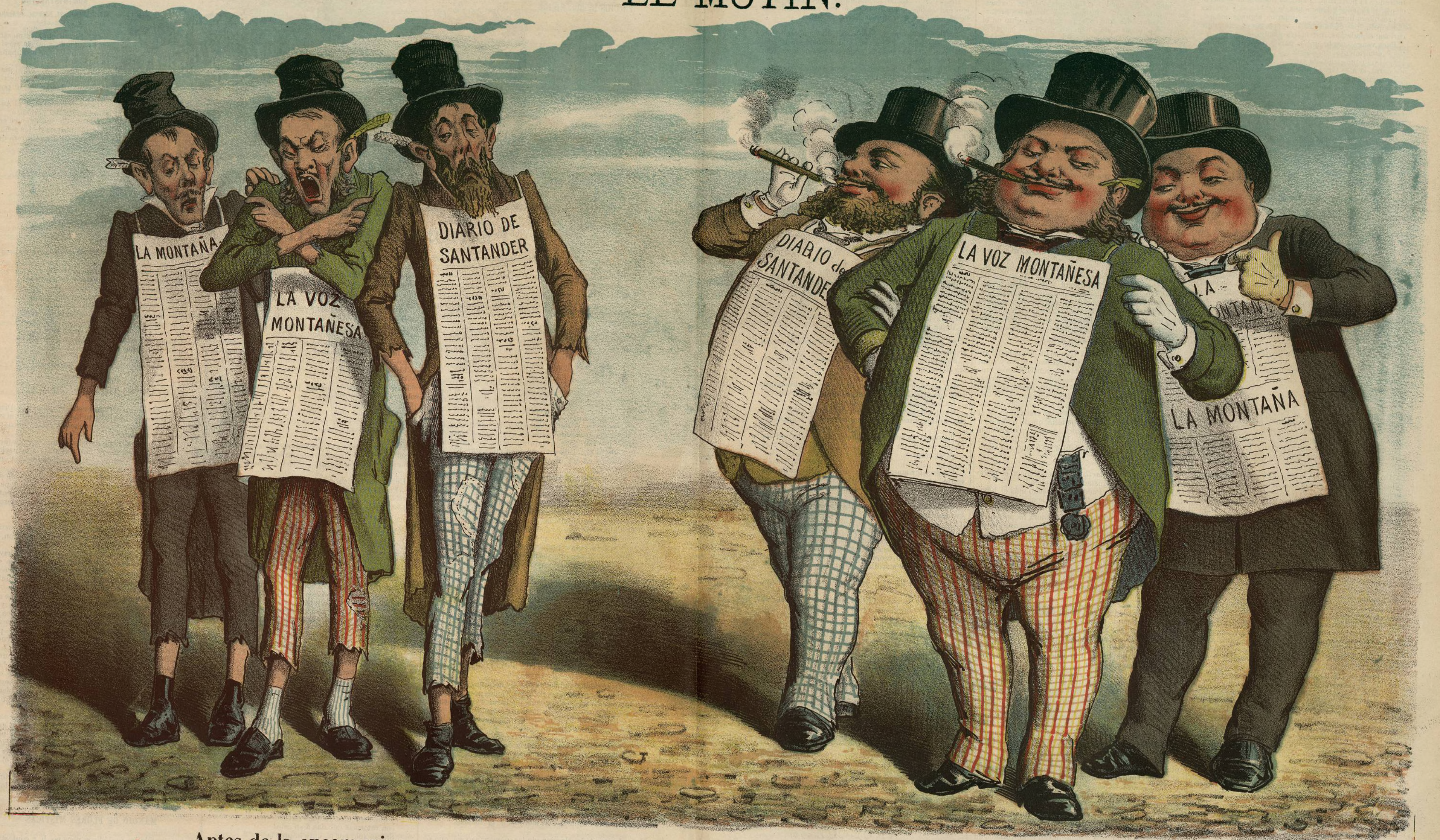
Antes de la excomunion.