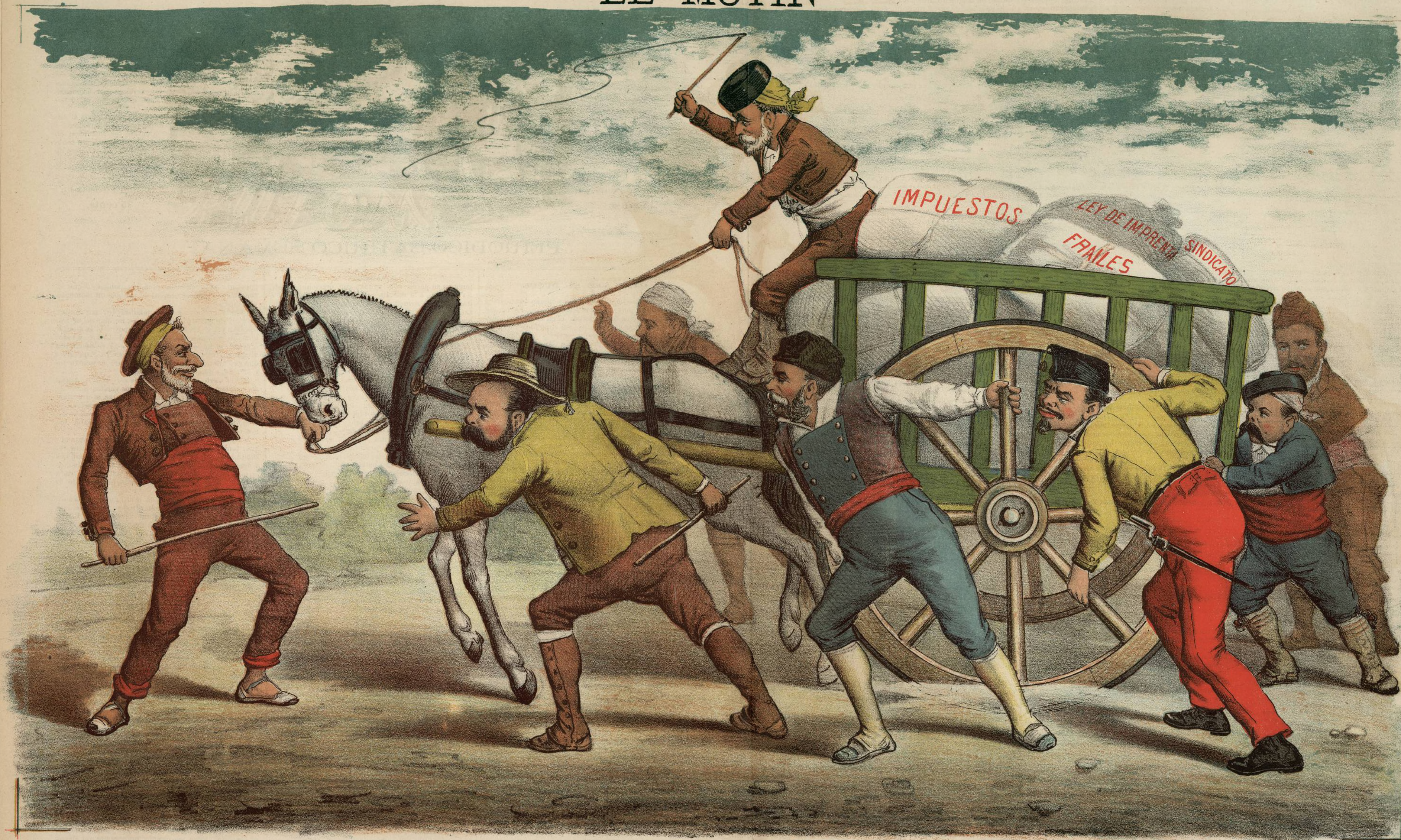
El carro de la situacion.