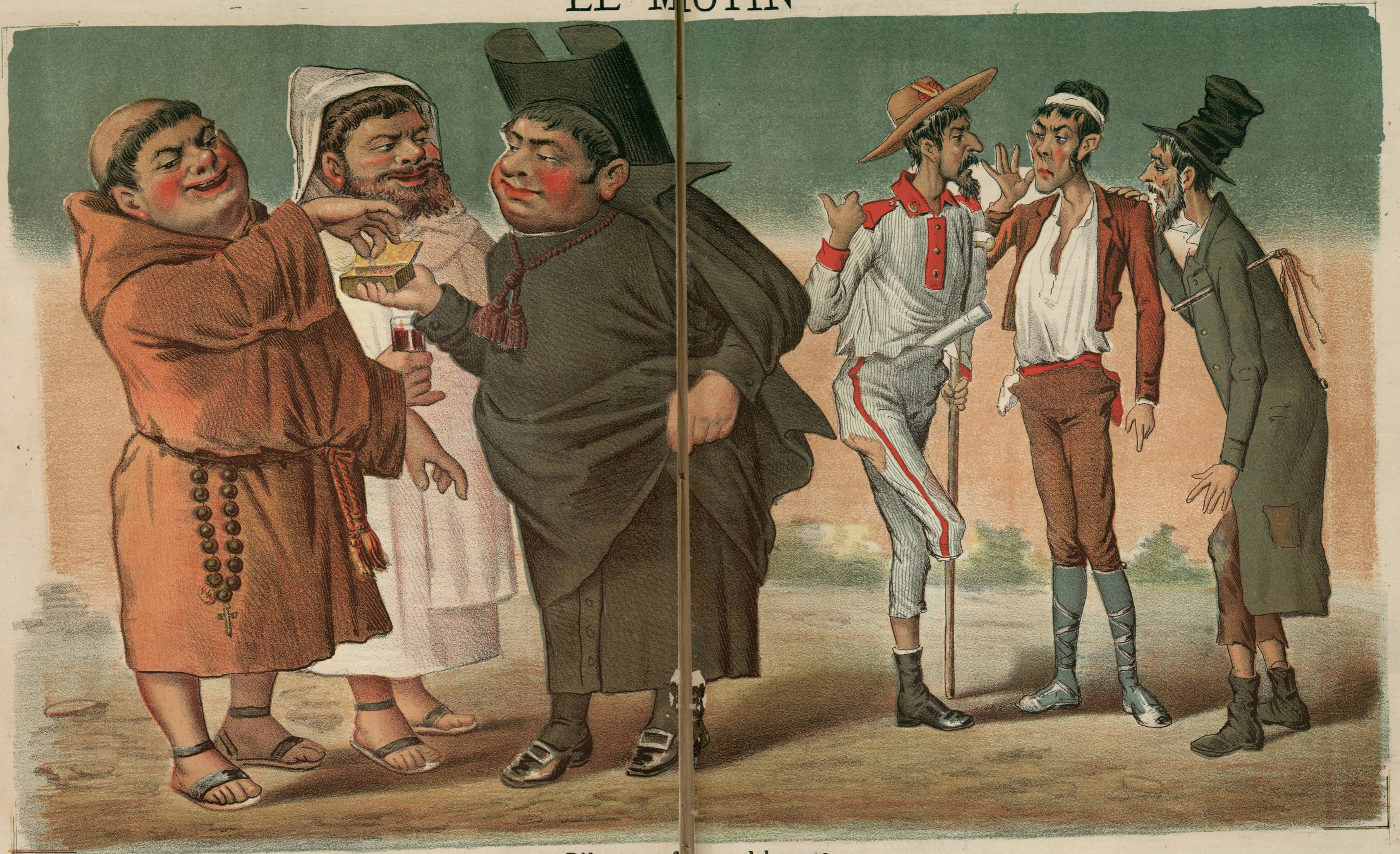
Diferentes efectos del ayuno.