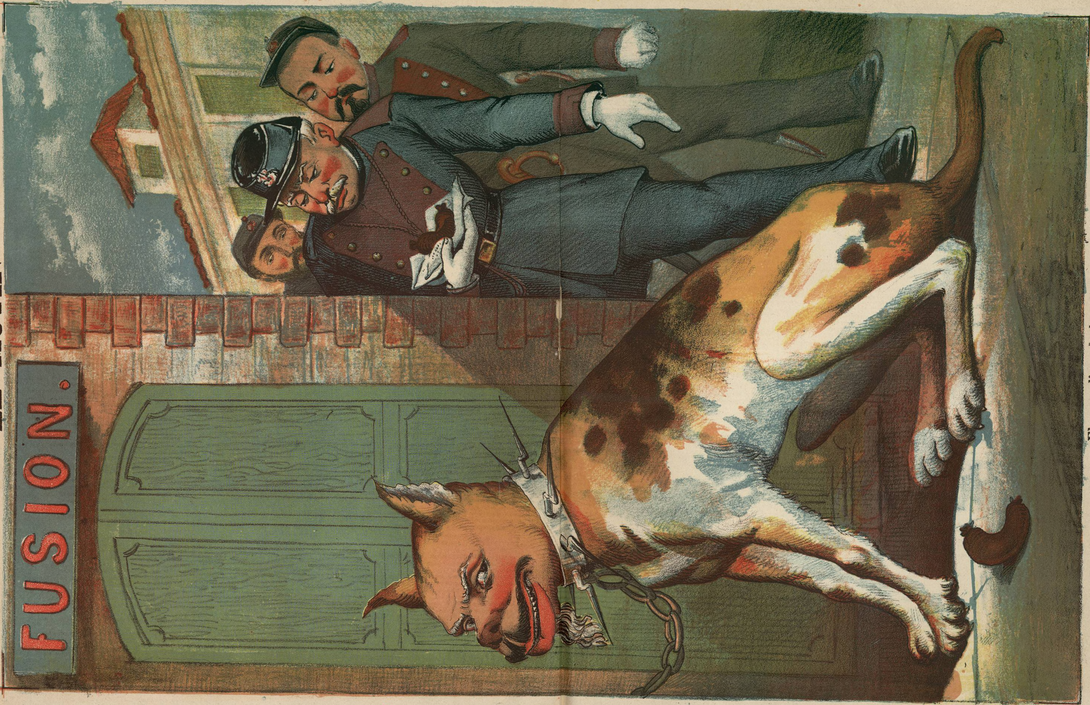
El guardian de la casa.