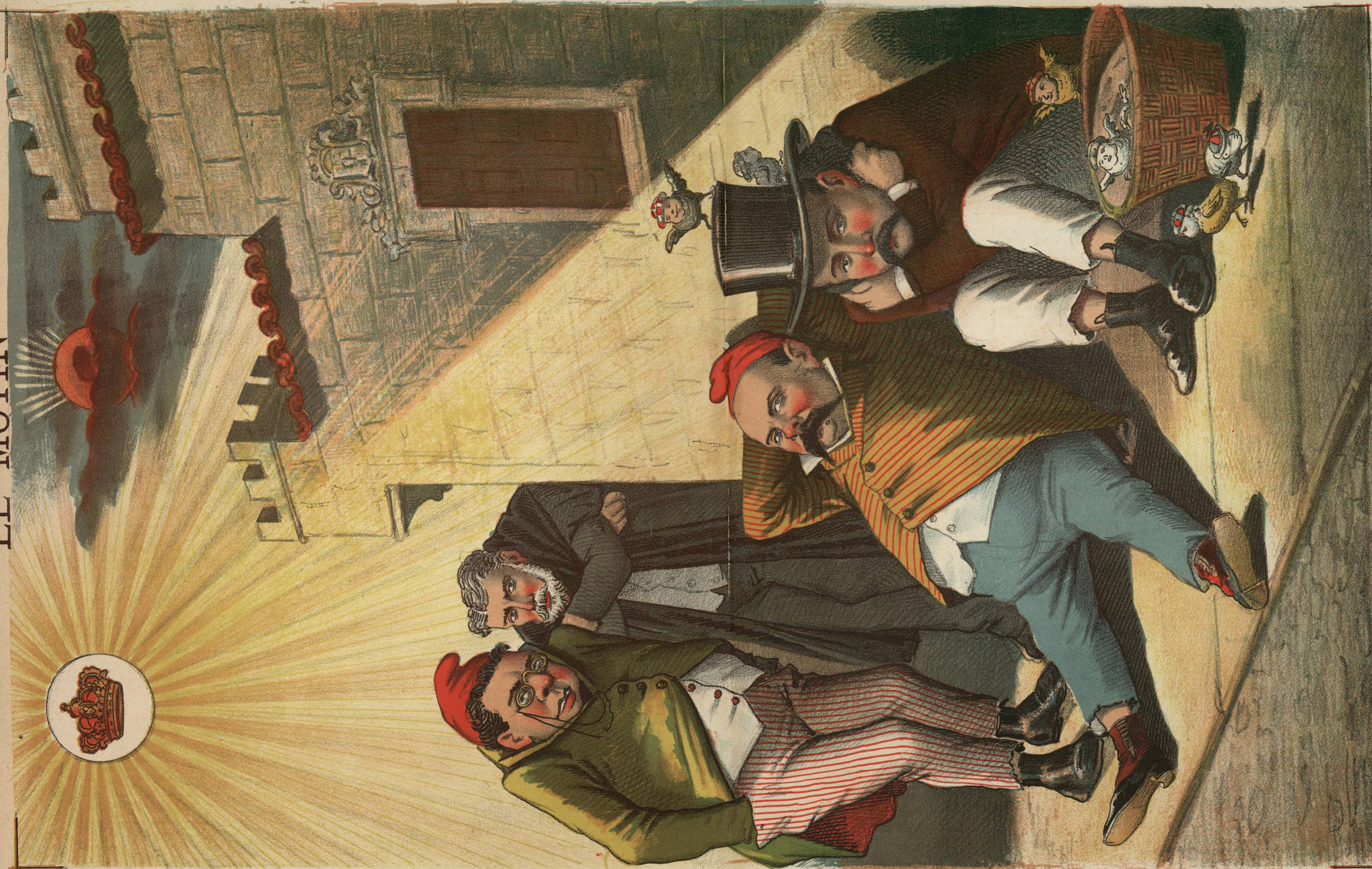
Los benévotos, arrimándose al sol que hoy más calienta.