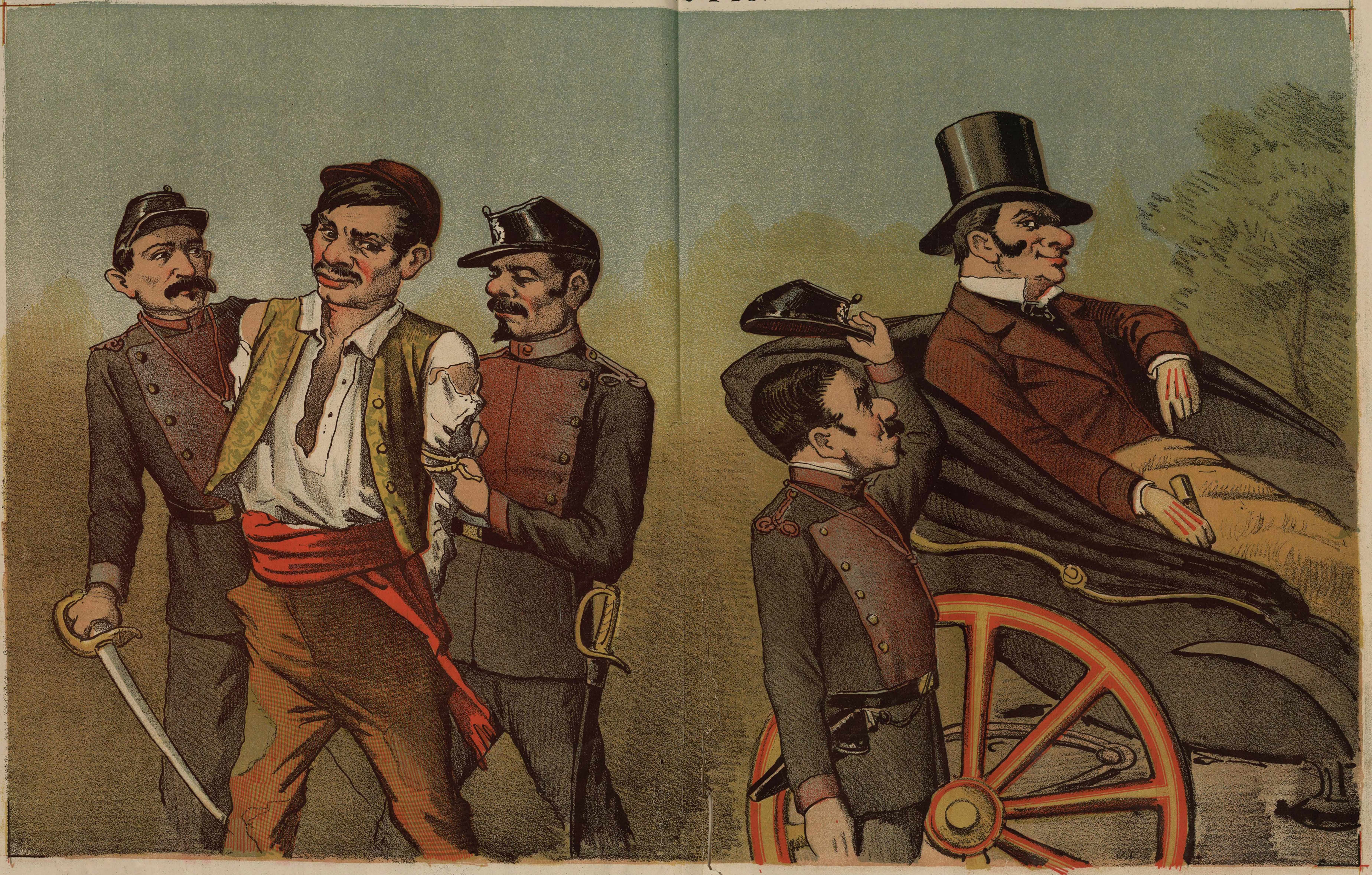
EL QUE ROBA POCO