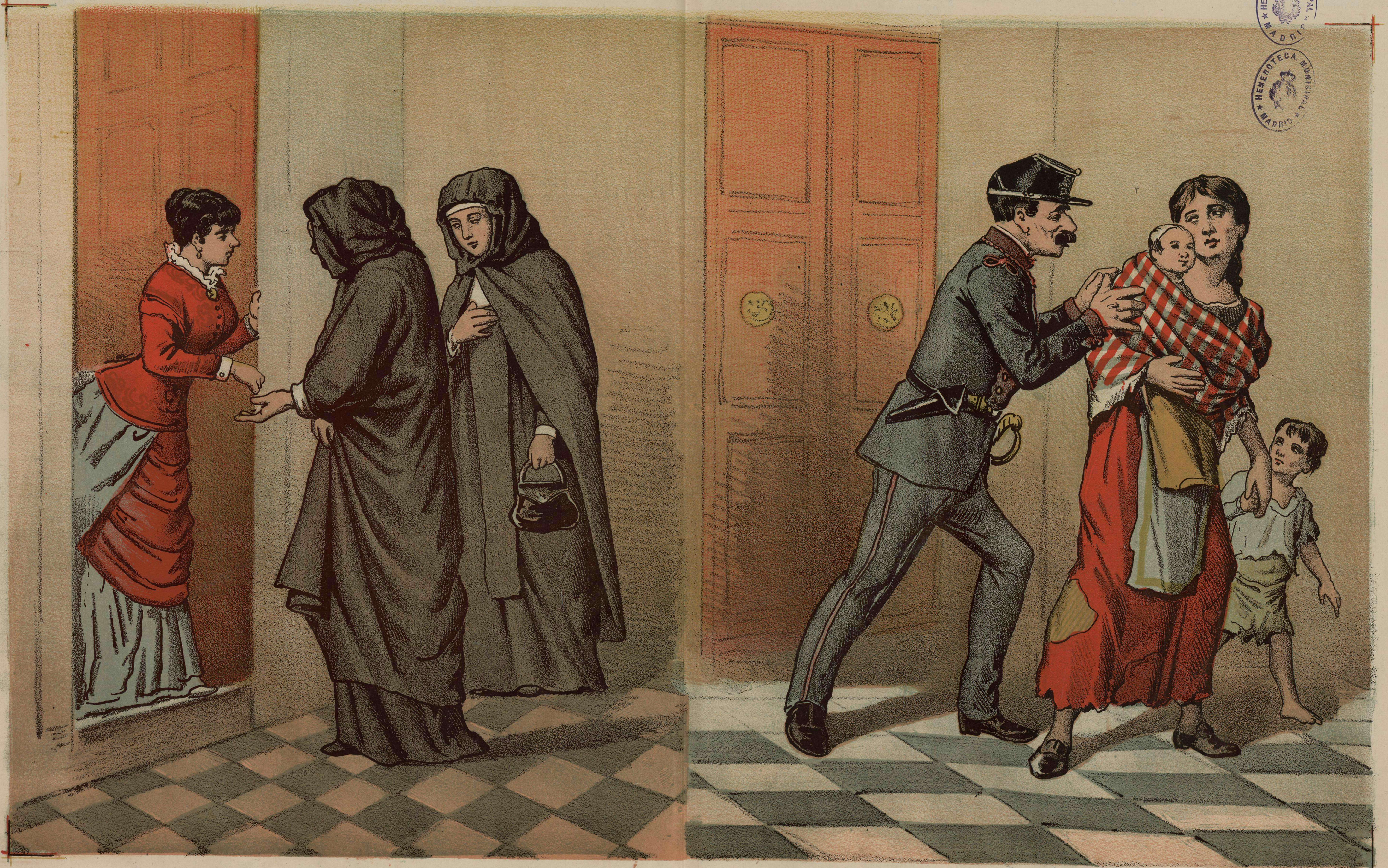
LA CARIDAD COMO VIRTUD