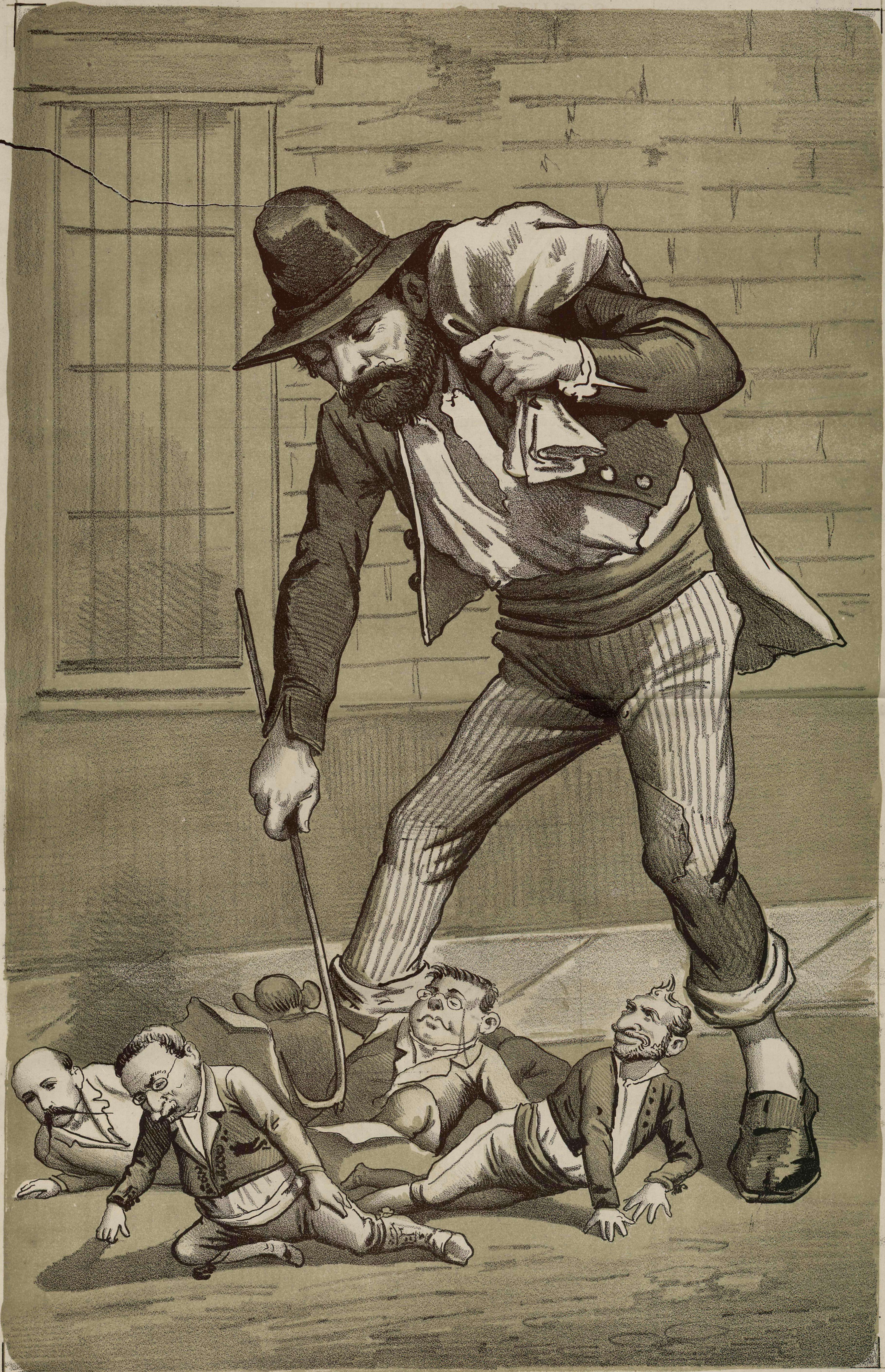
EL PUEBLO Y LOS POLÍTICOS