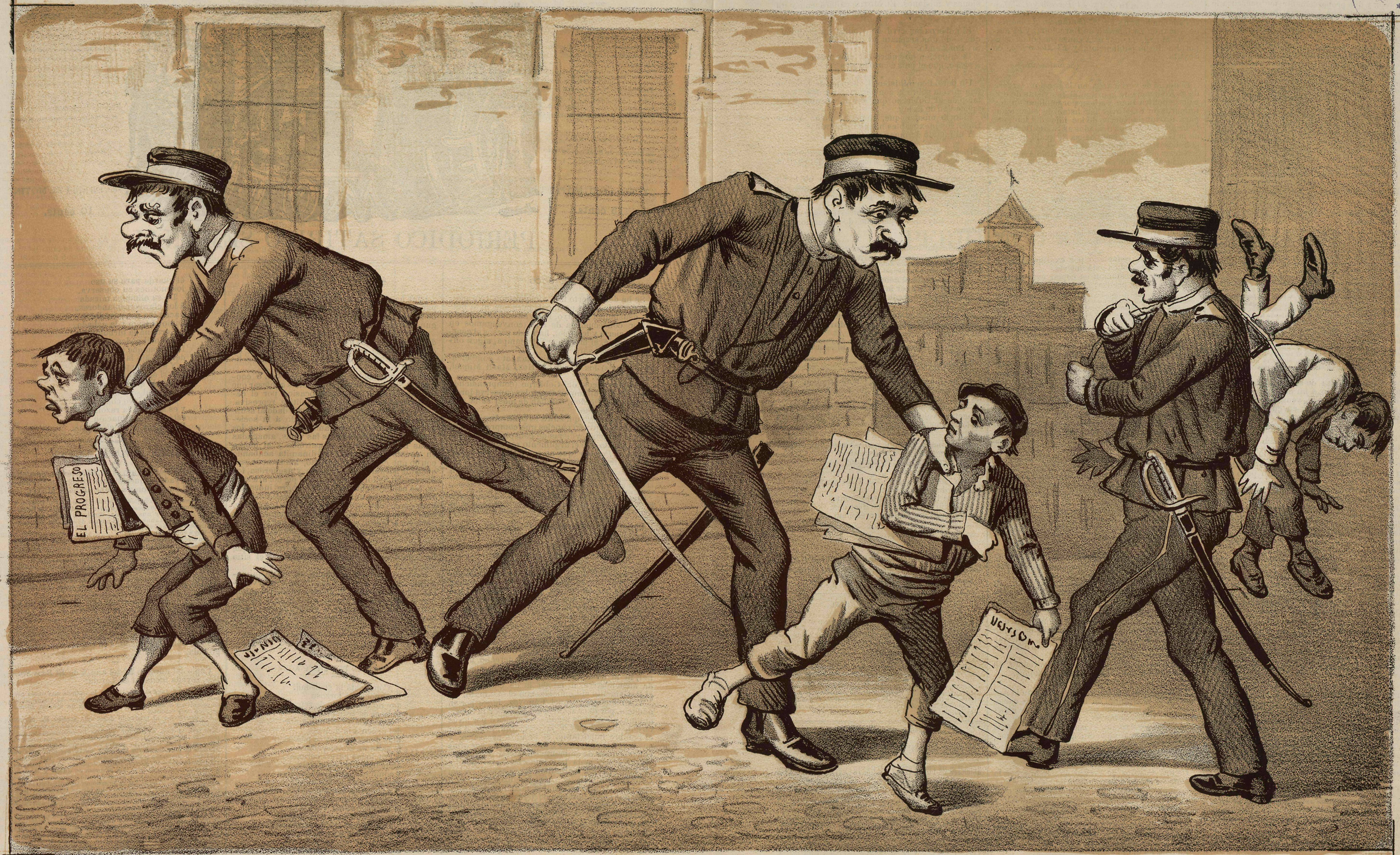
OCUPACION PREFERENTE DE LA POLICÍA EN ESTOS TIEMPOS CONSERVADORES