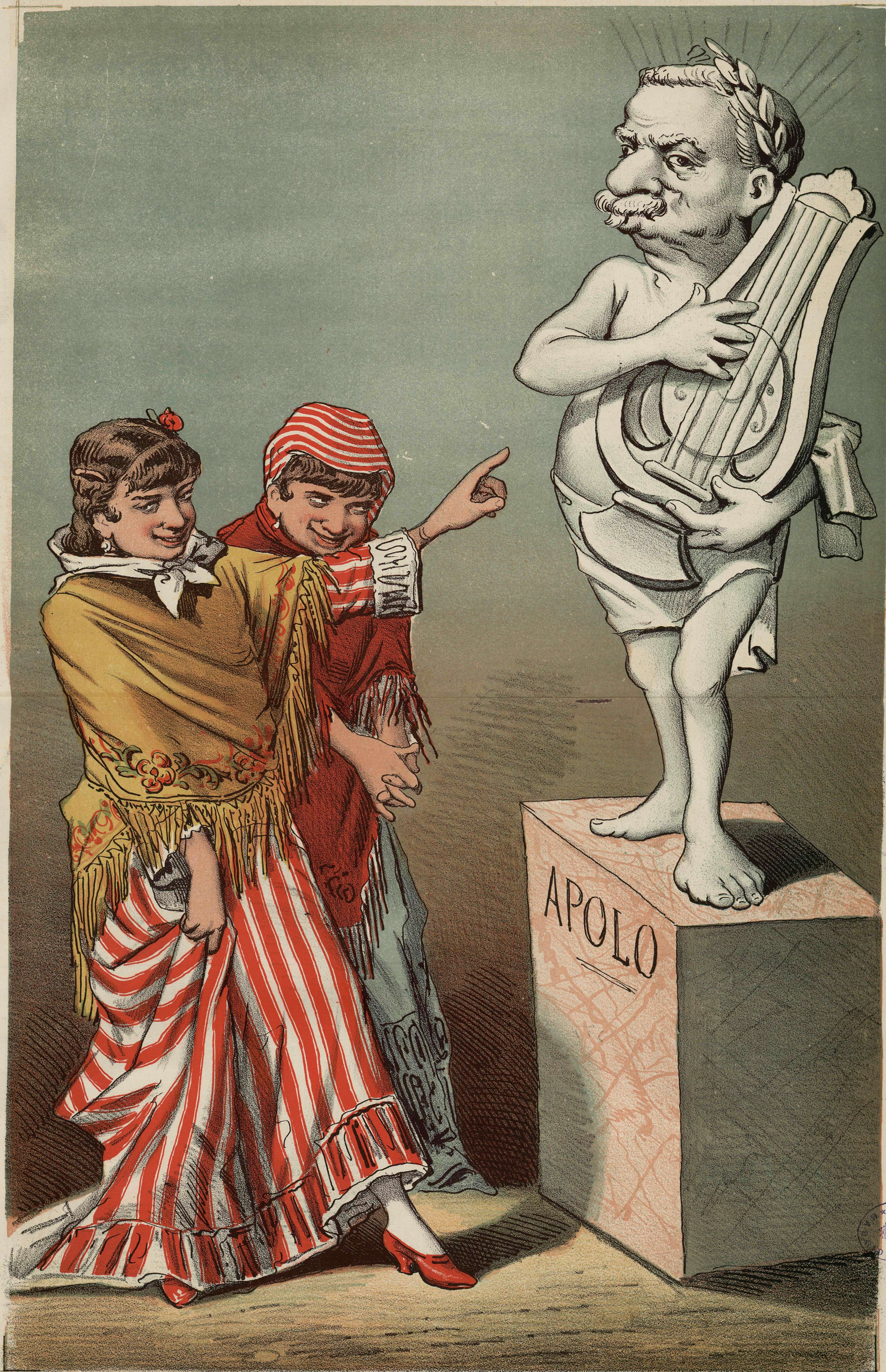
ESTATUA QUE LA POSTERIDAD LEVANTARÁ AL INSPIRADO CANTOR DE ELISA (A) APOLO DE MALVEDERE