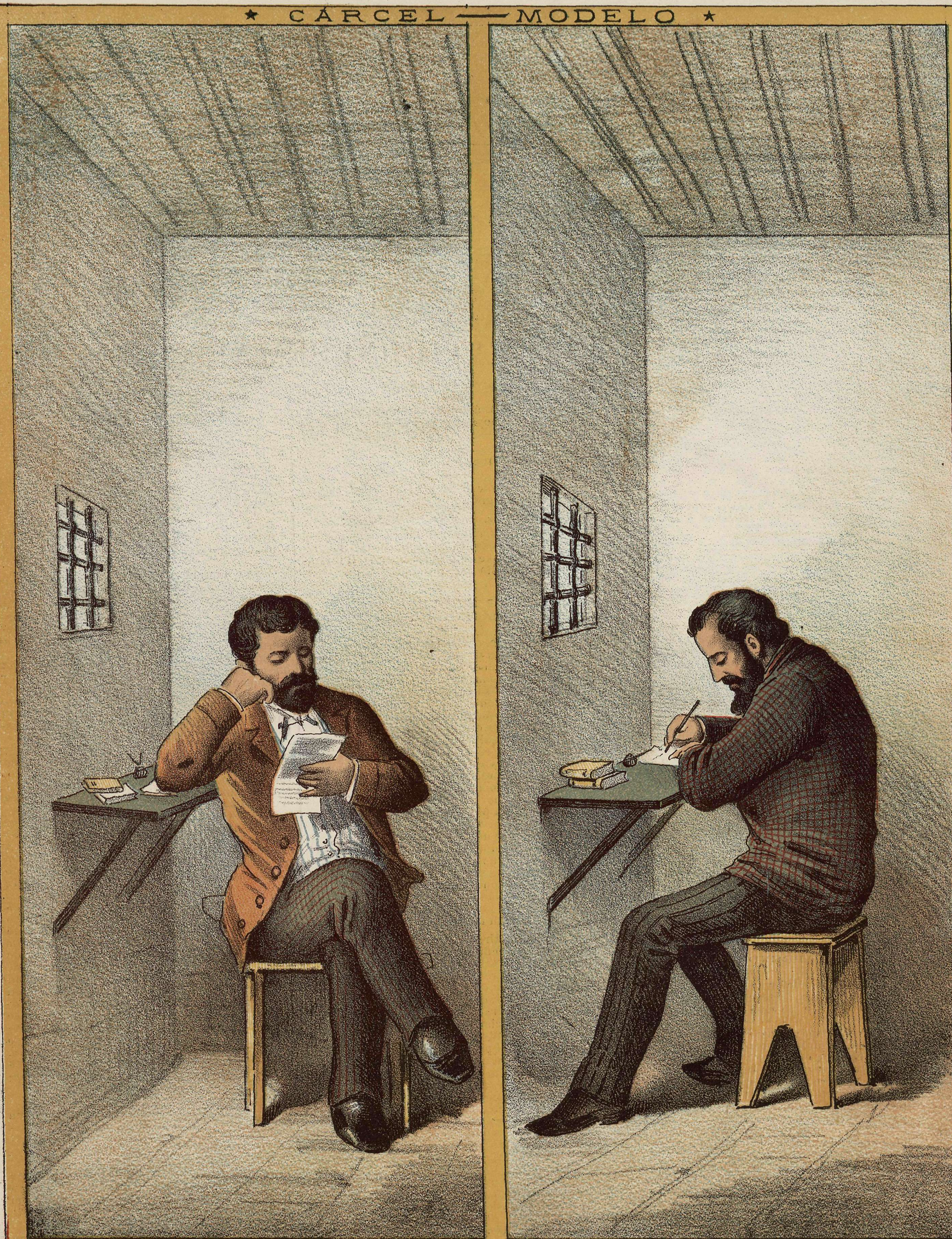
LIBERTAD DE PENSAMIENTO.