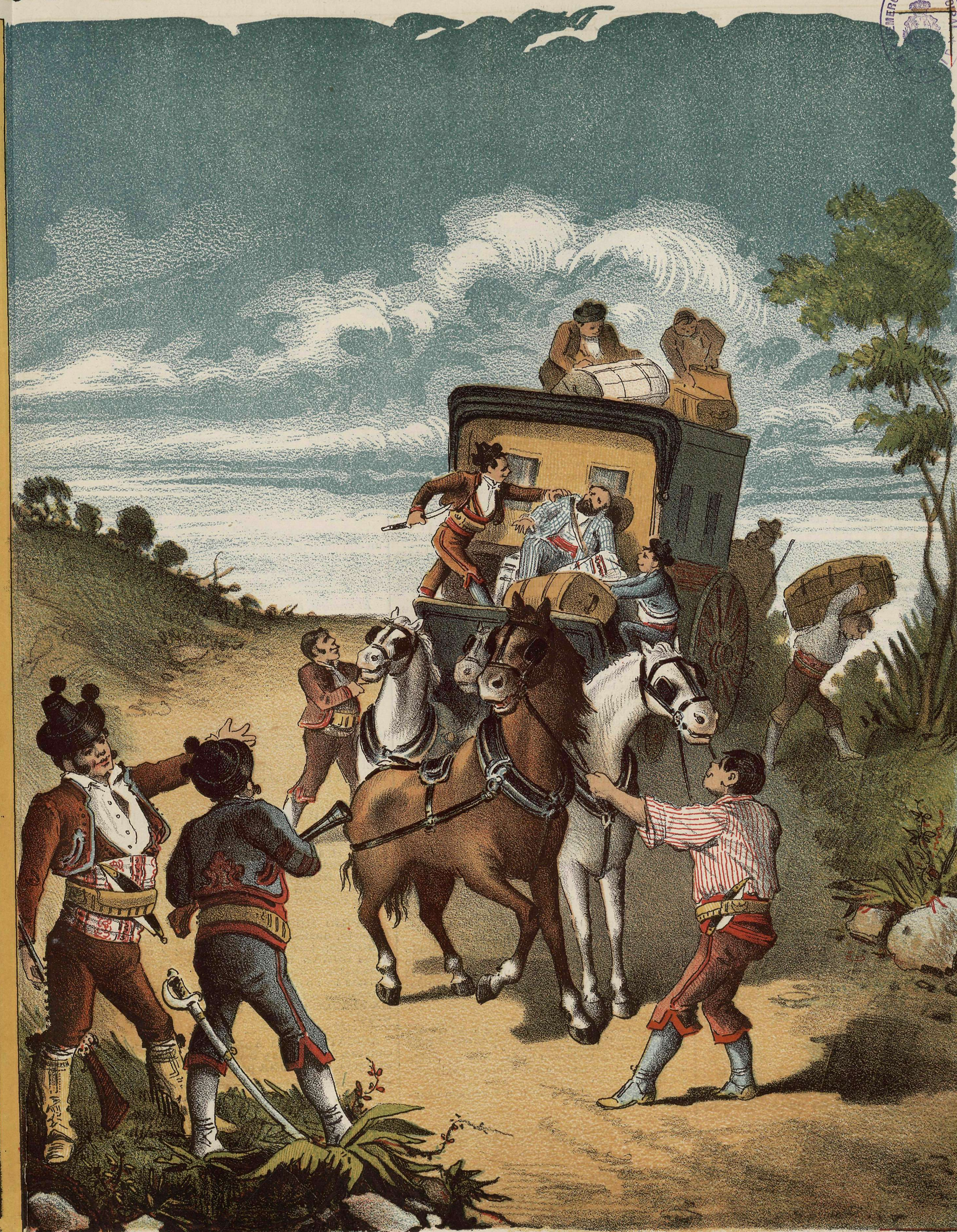
LIBERTAD DE ACCION.