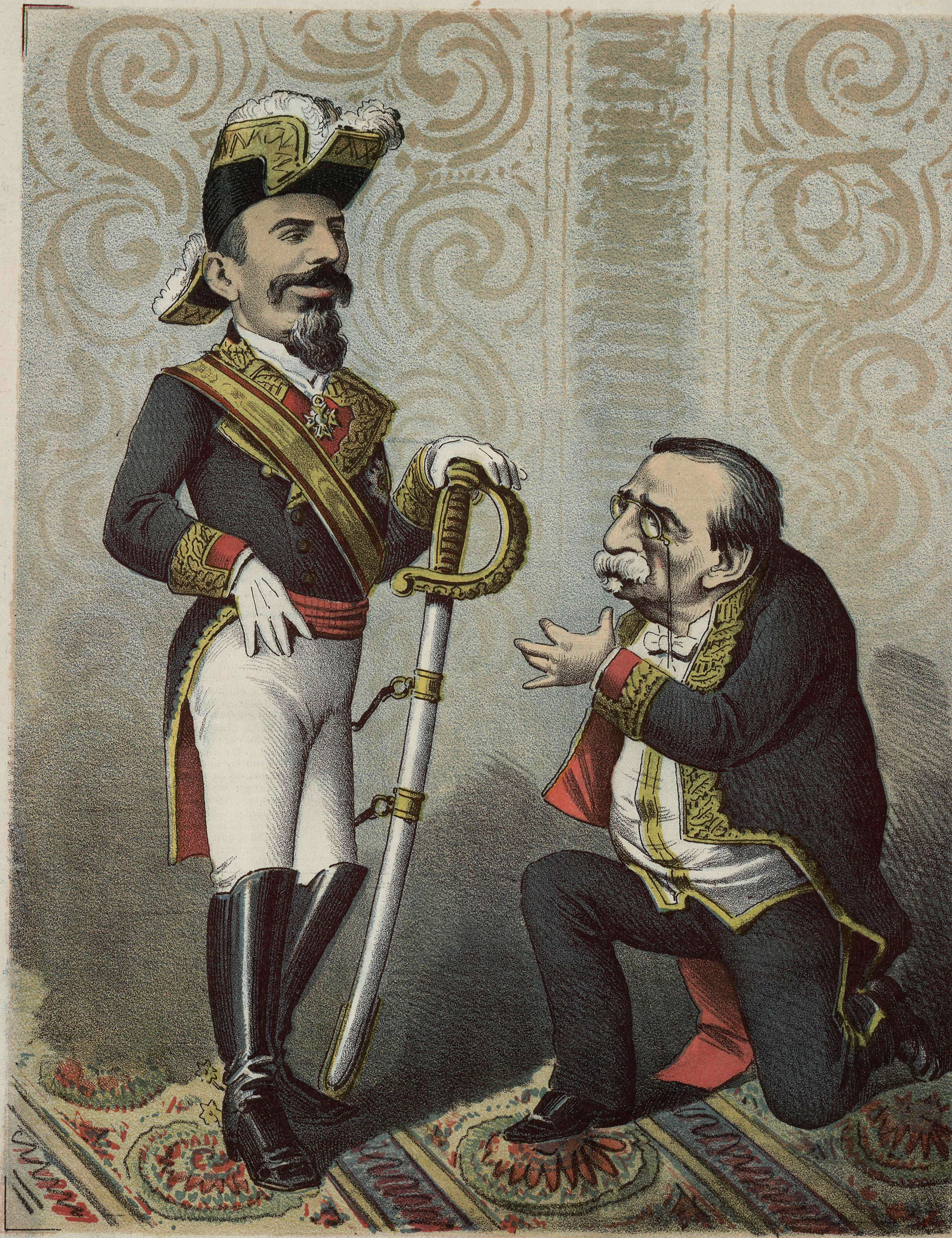
ANTE EL EXITO.