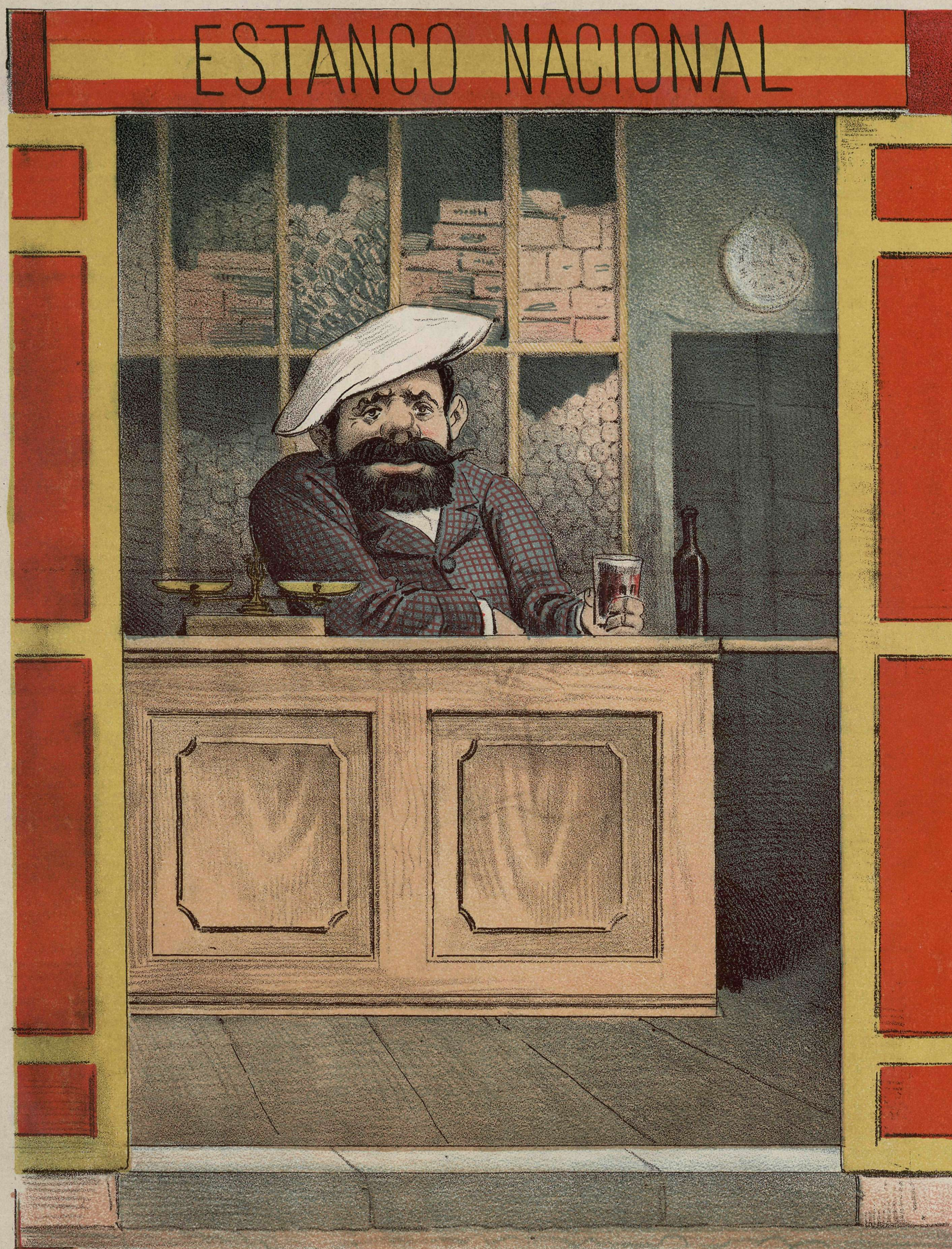
Premio del que ataca la libertad.