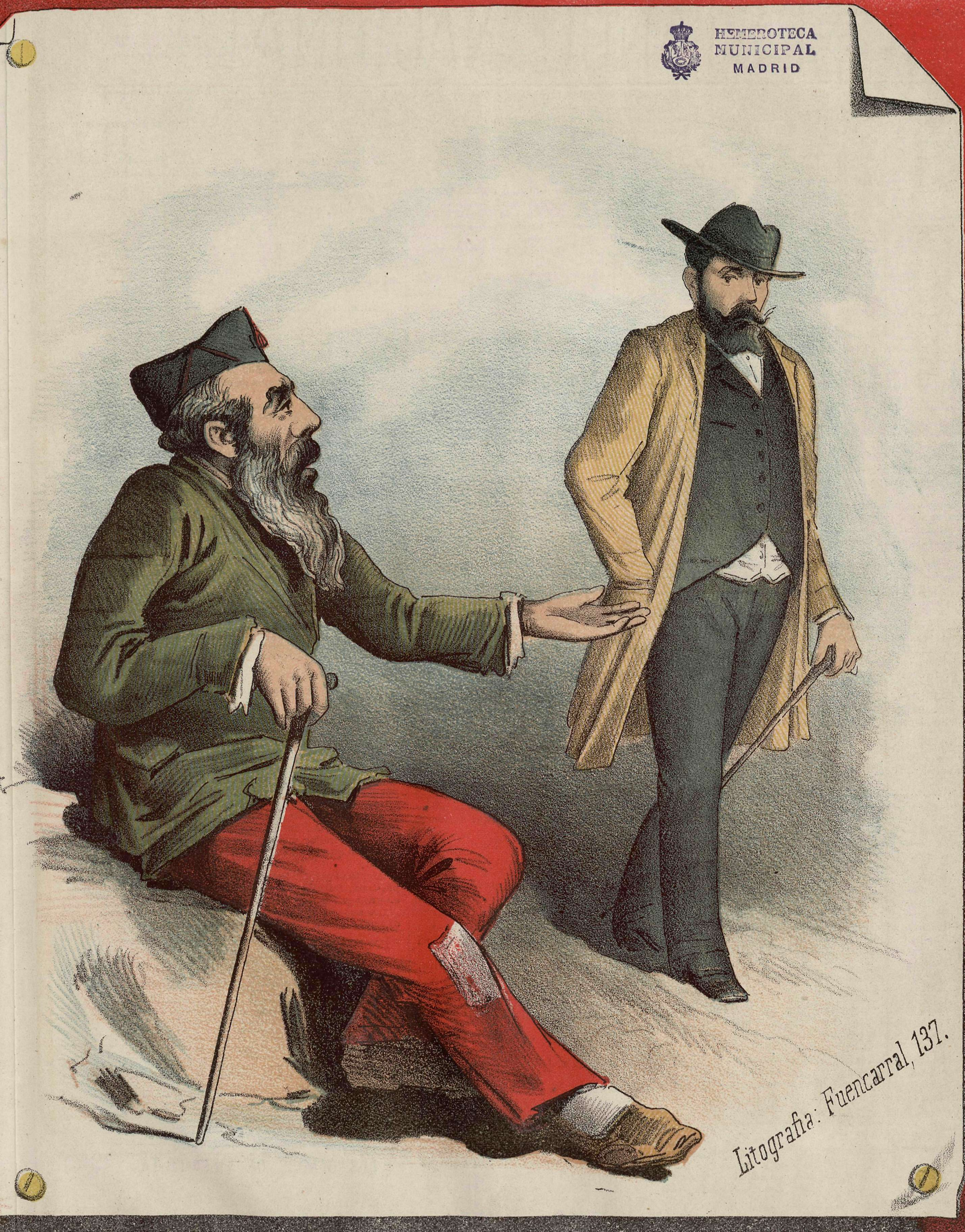
Premio del que defiende la libertad.