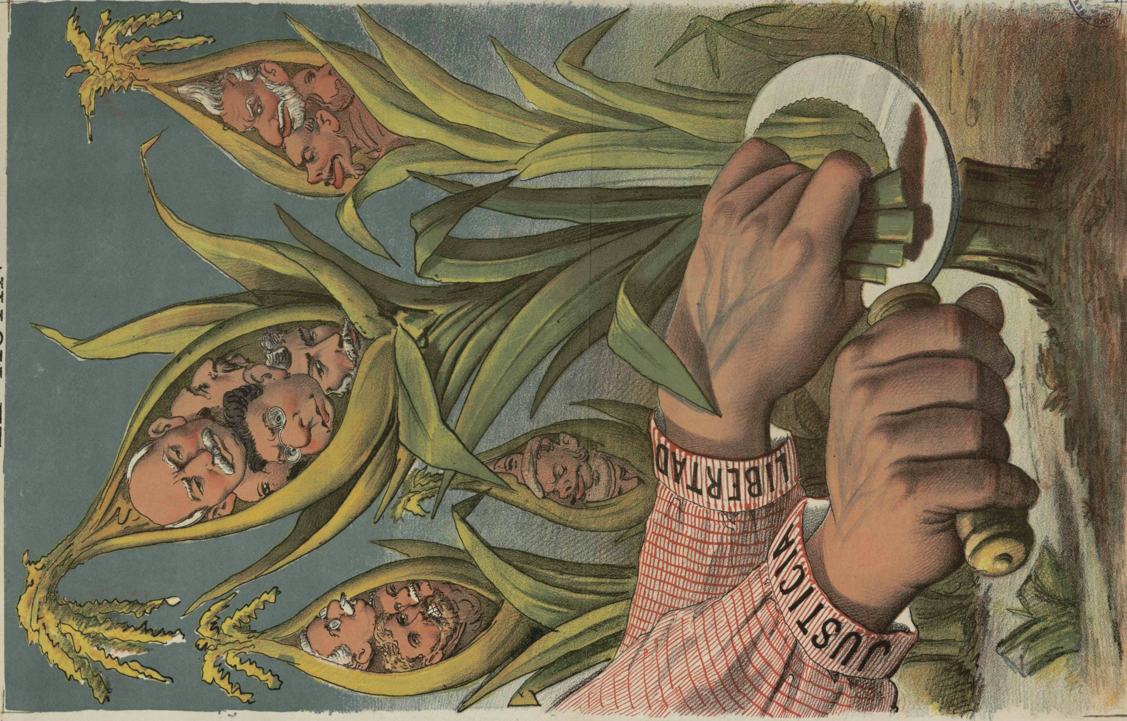
Aguinaldo que EL MOTIN quisiera ofrecer al país algun día.