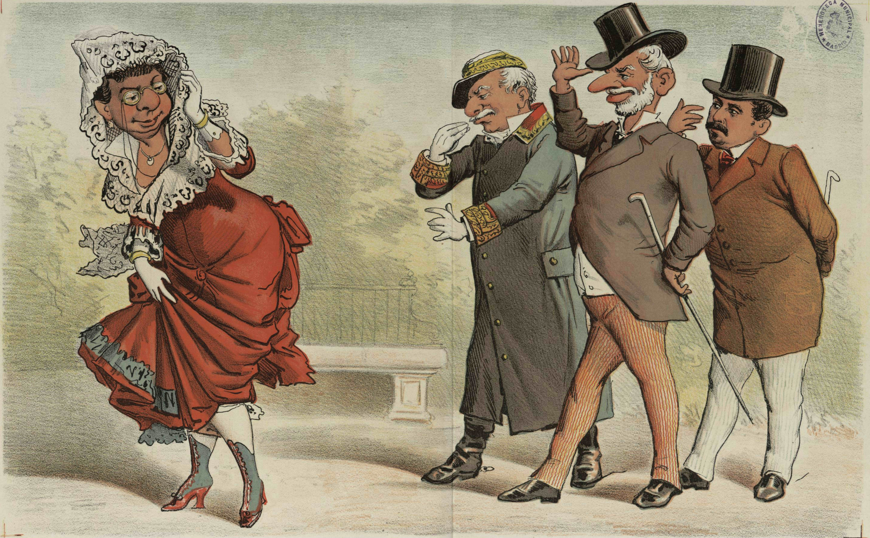
Honestidad política de Martos.