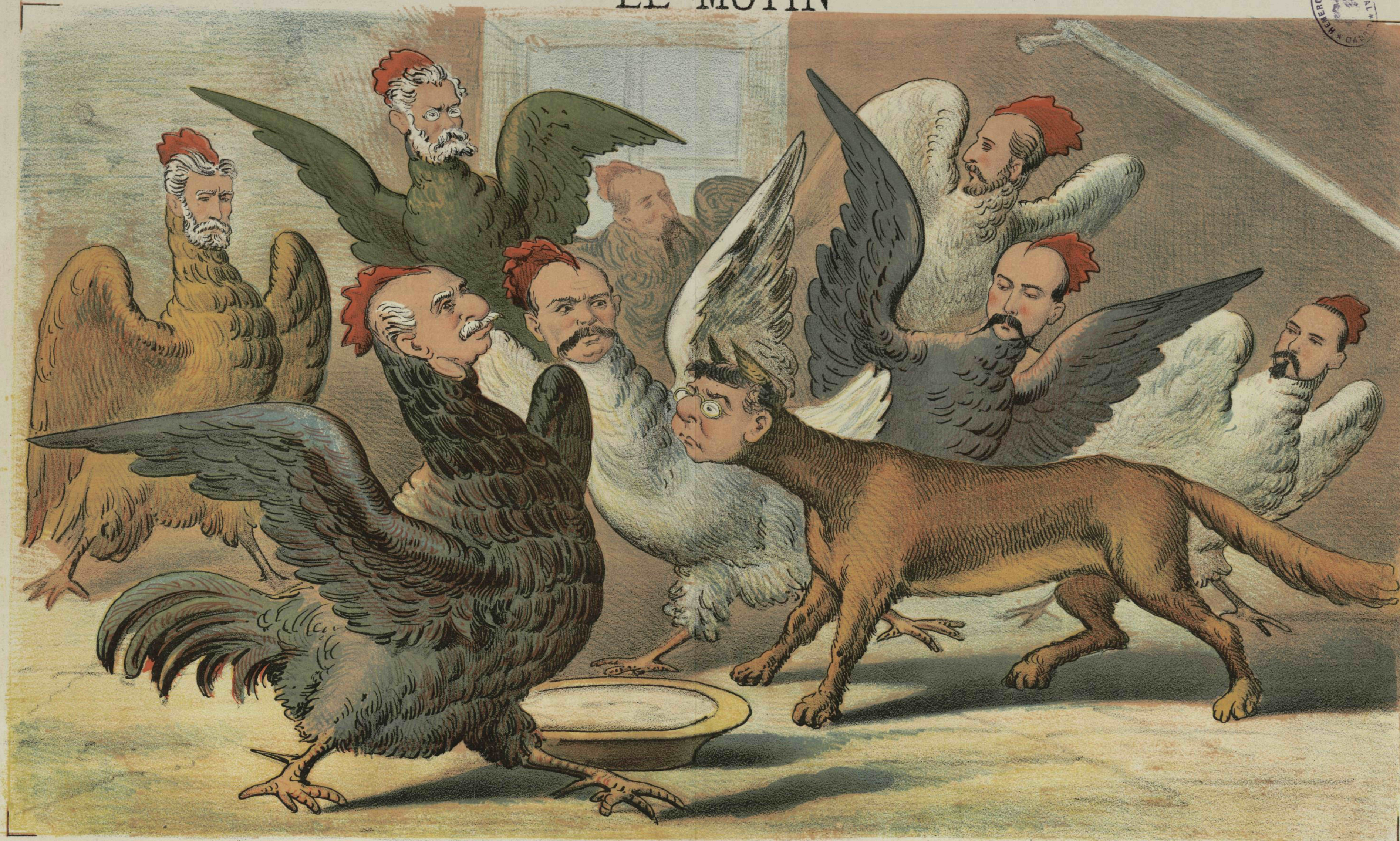
La Zorra en el gallinero Zurdo.