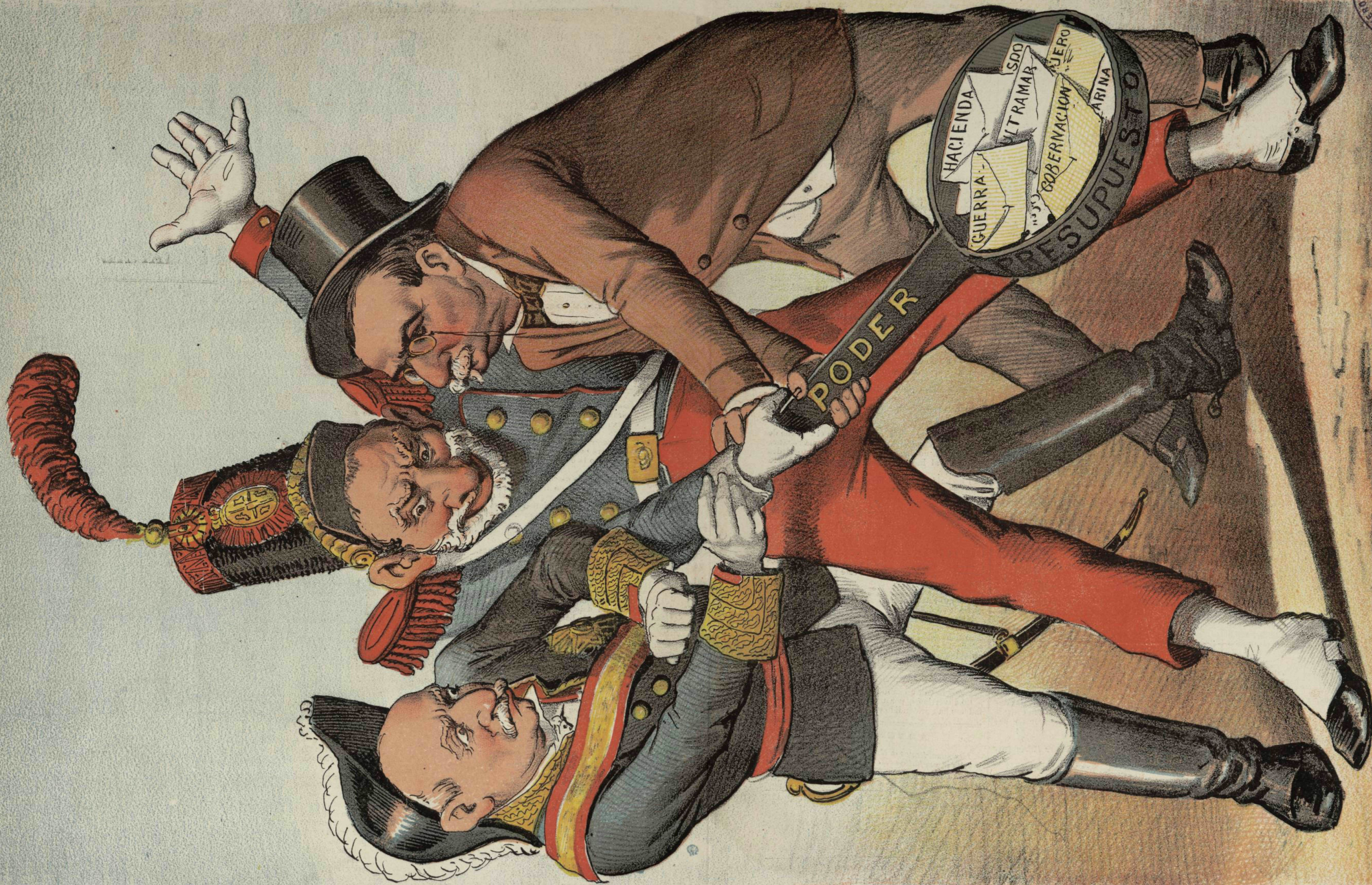
El móvil de los partidos monárquicos.