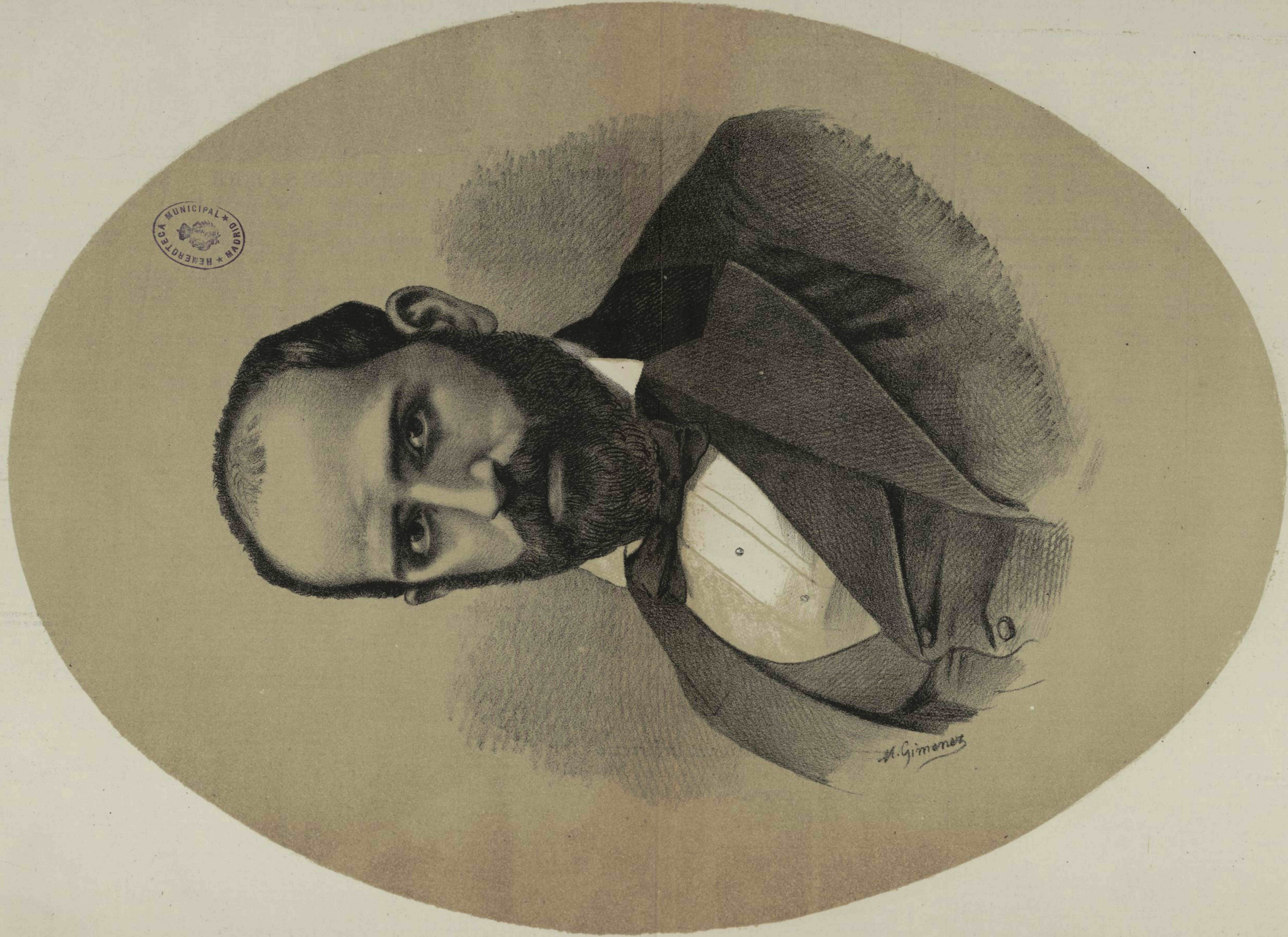
D. NICOLAS SALMERON.