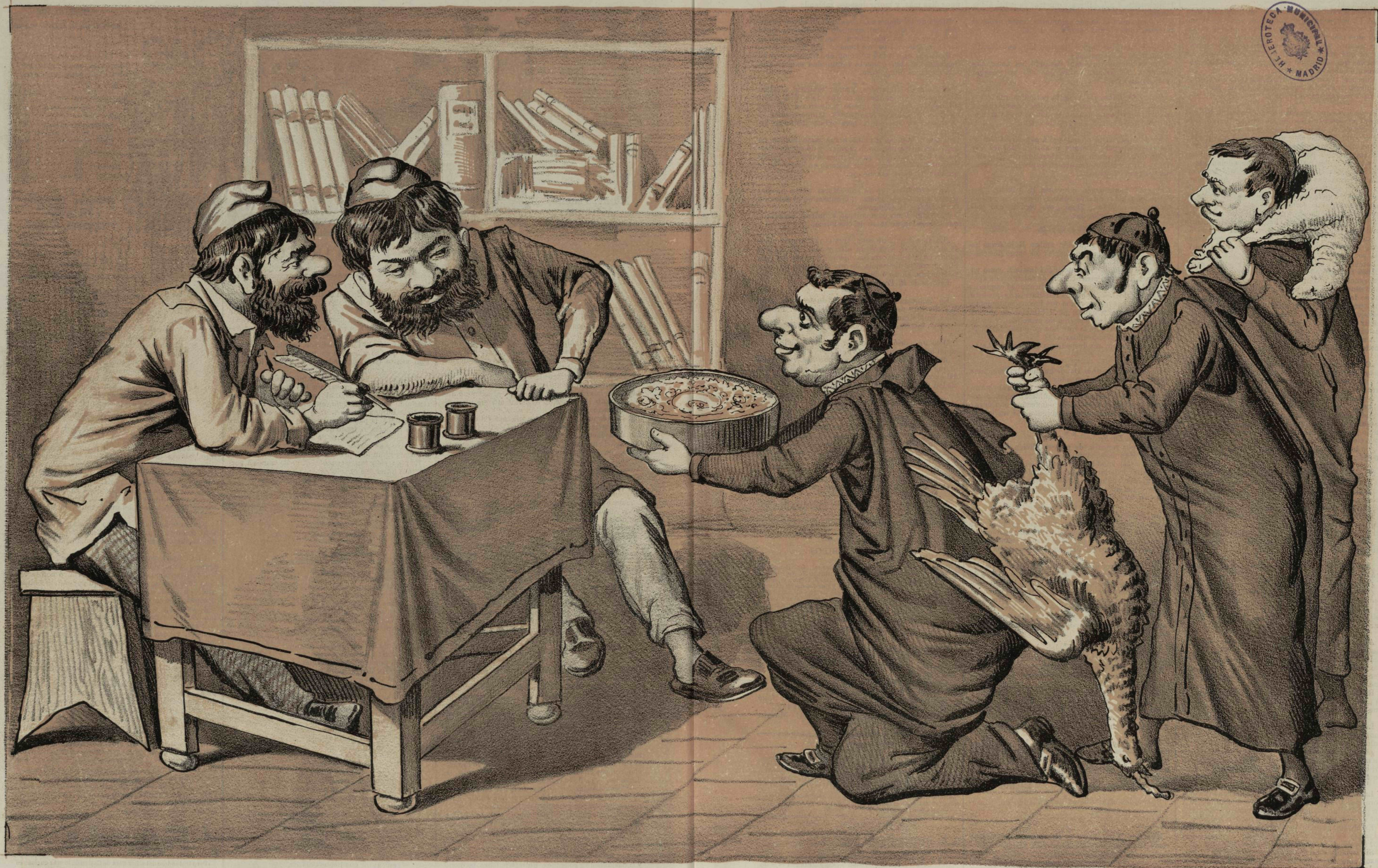
Regalos de pascuas hechos á EL MOTIN por los sotanas agradecidos