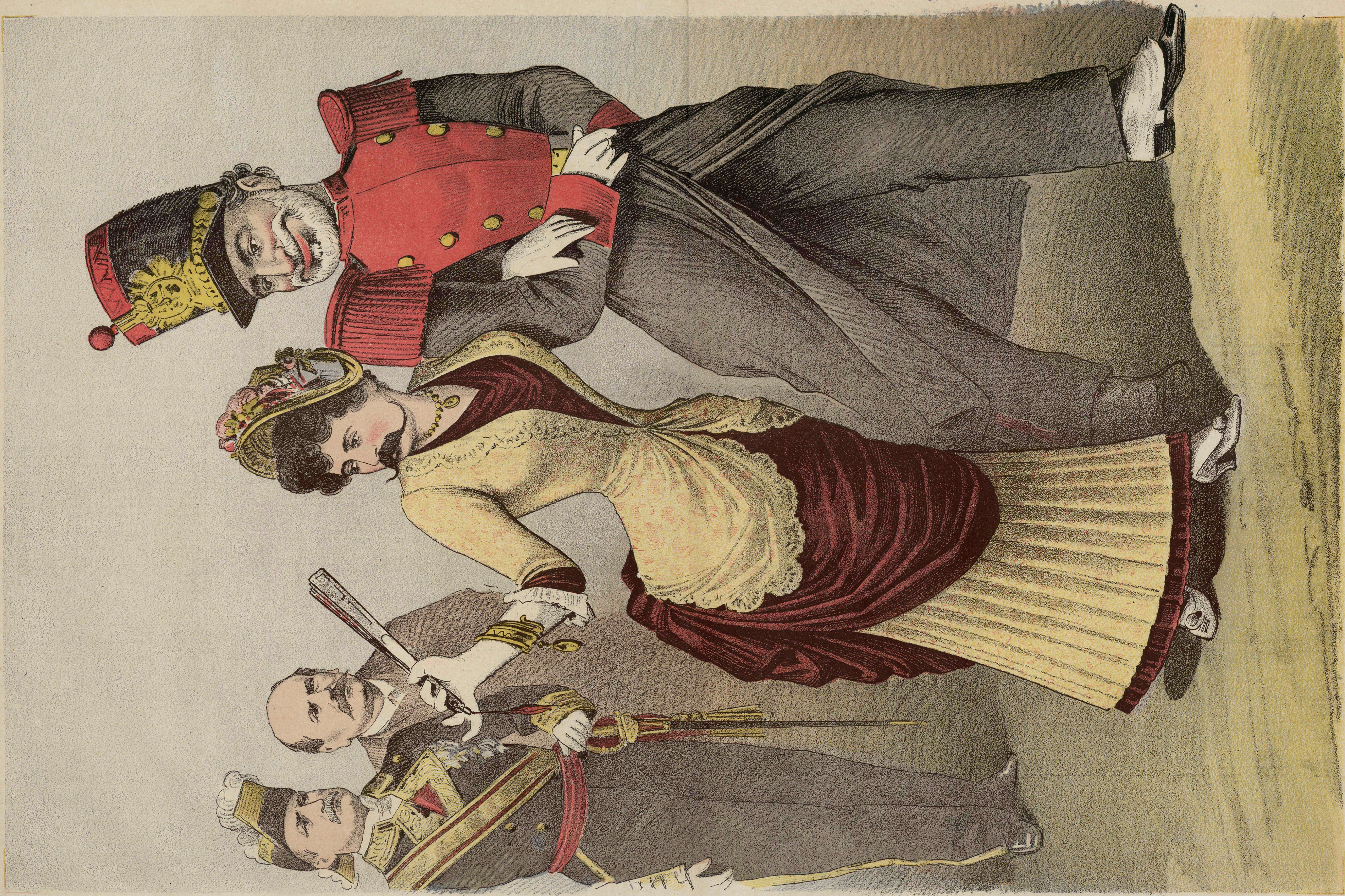
Última veleidad. (por ahora).