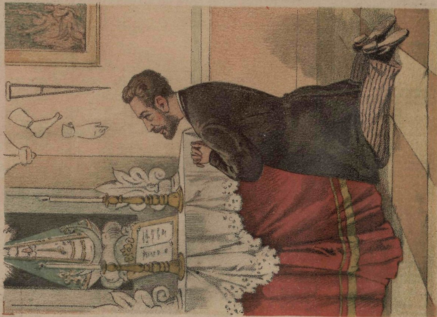
En su oratorio. — ¡Señora y madre del Redentor! No me niegues tu favor y dame una buena hora.