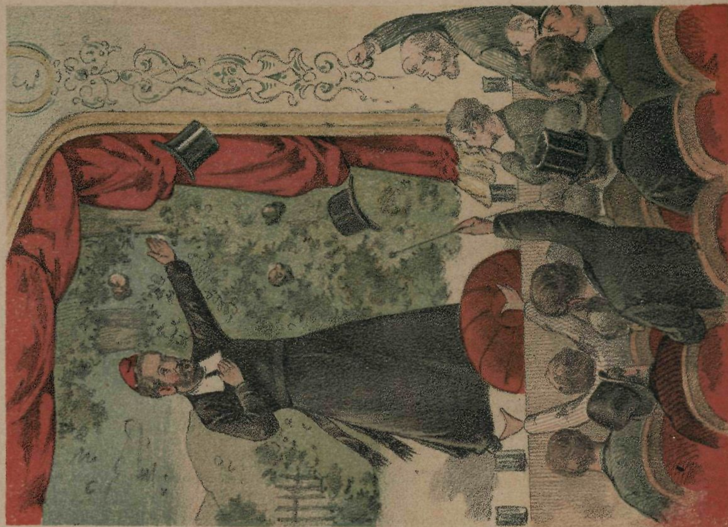
En el teatro. — Pero hasta que el en Valles, por distracción ó descuido se presente así vestido, no se exhibirá cual es.