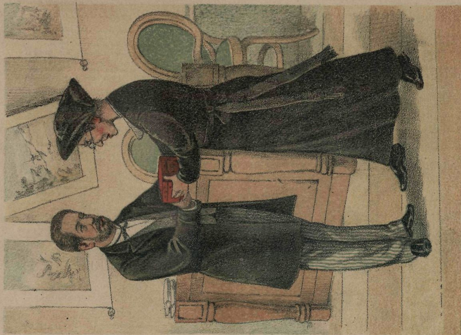
En su despacho. — Daría de ingrato una prueba clara si obediente no ayudara á la santa Compañía.