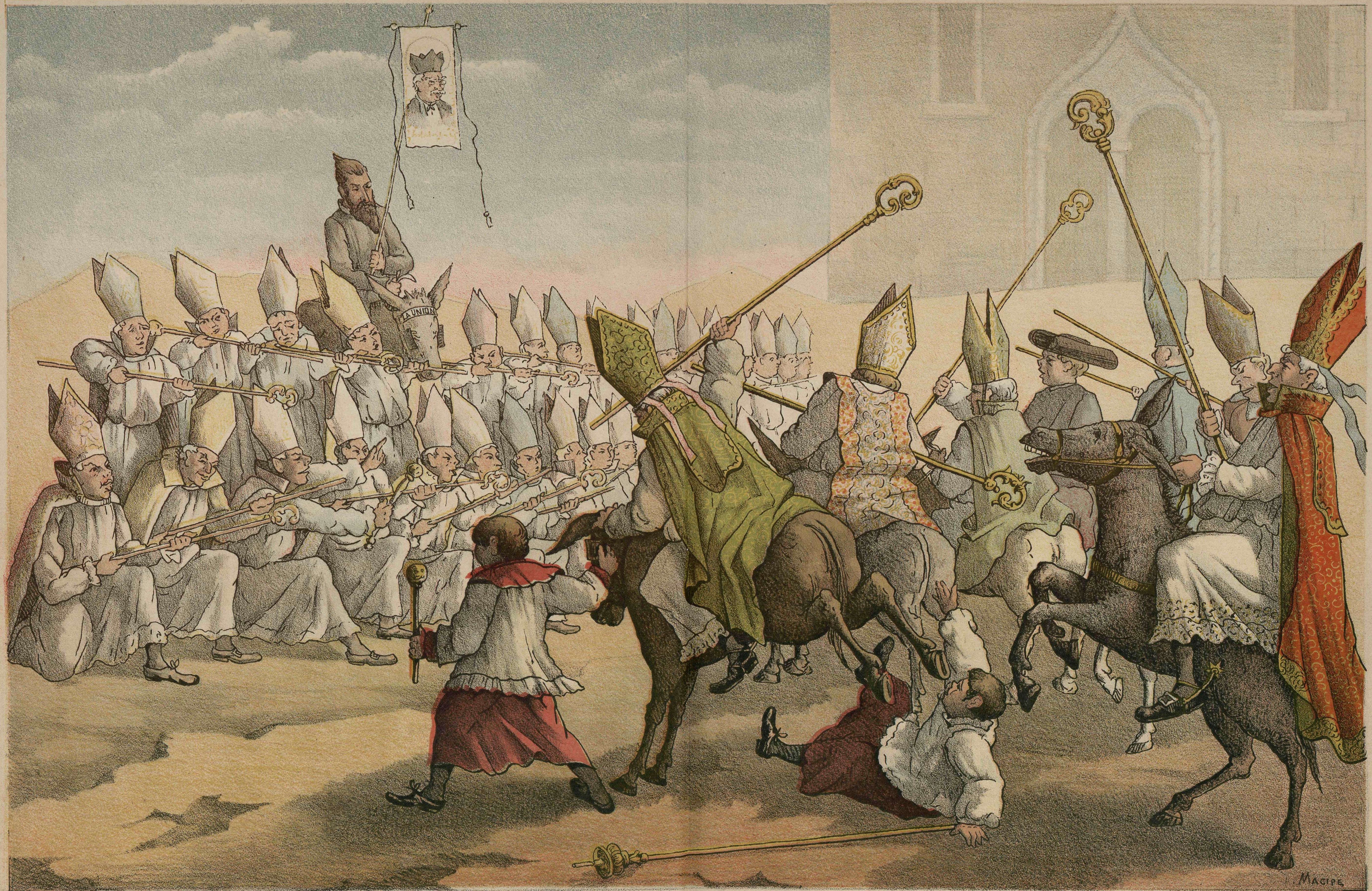
Cisma en la iglesia Católica, segun declaración de un Arzobispo.