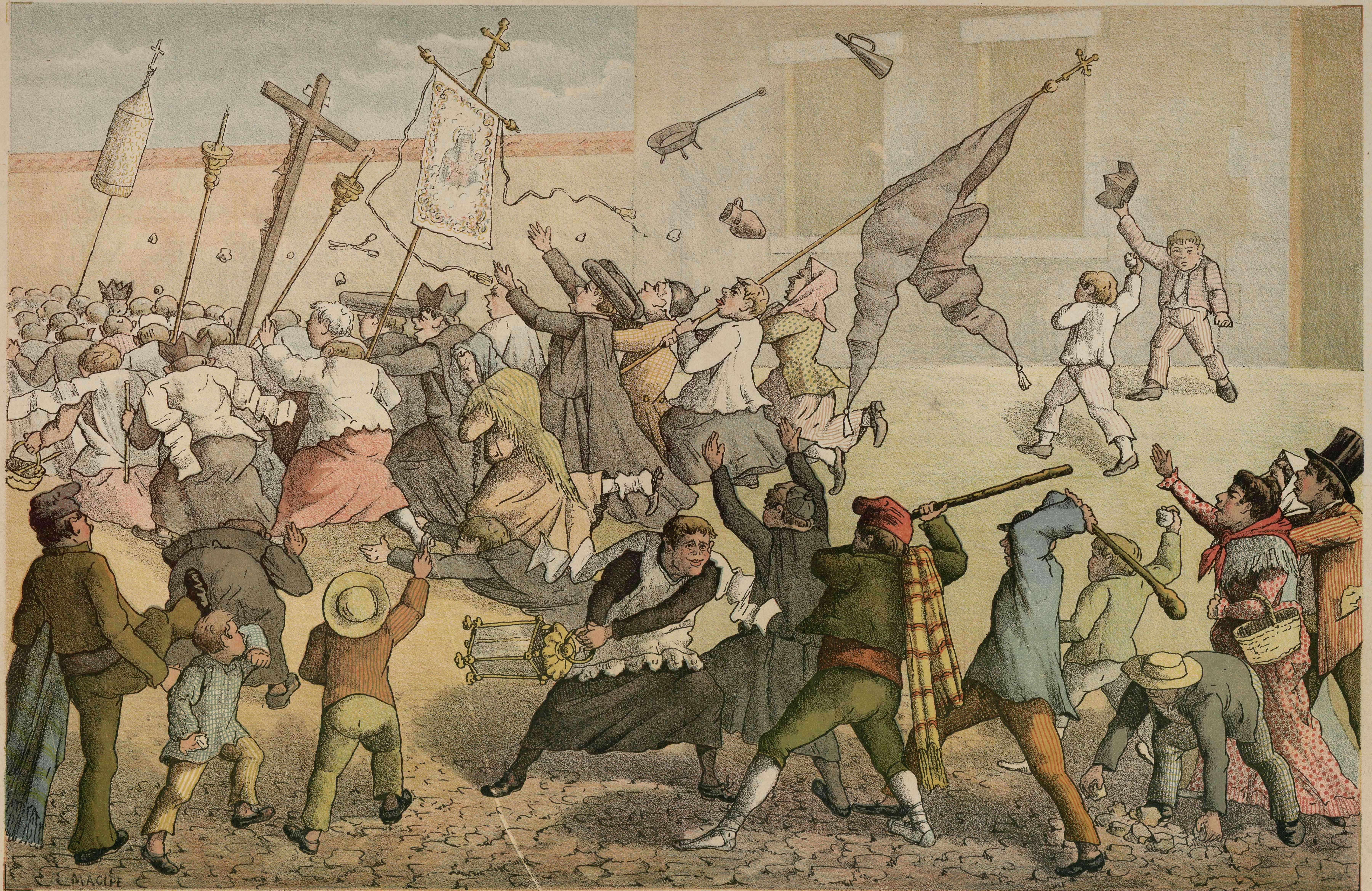
Cómo acaban algunos rosarios de la Aurora en Cataluña.