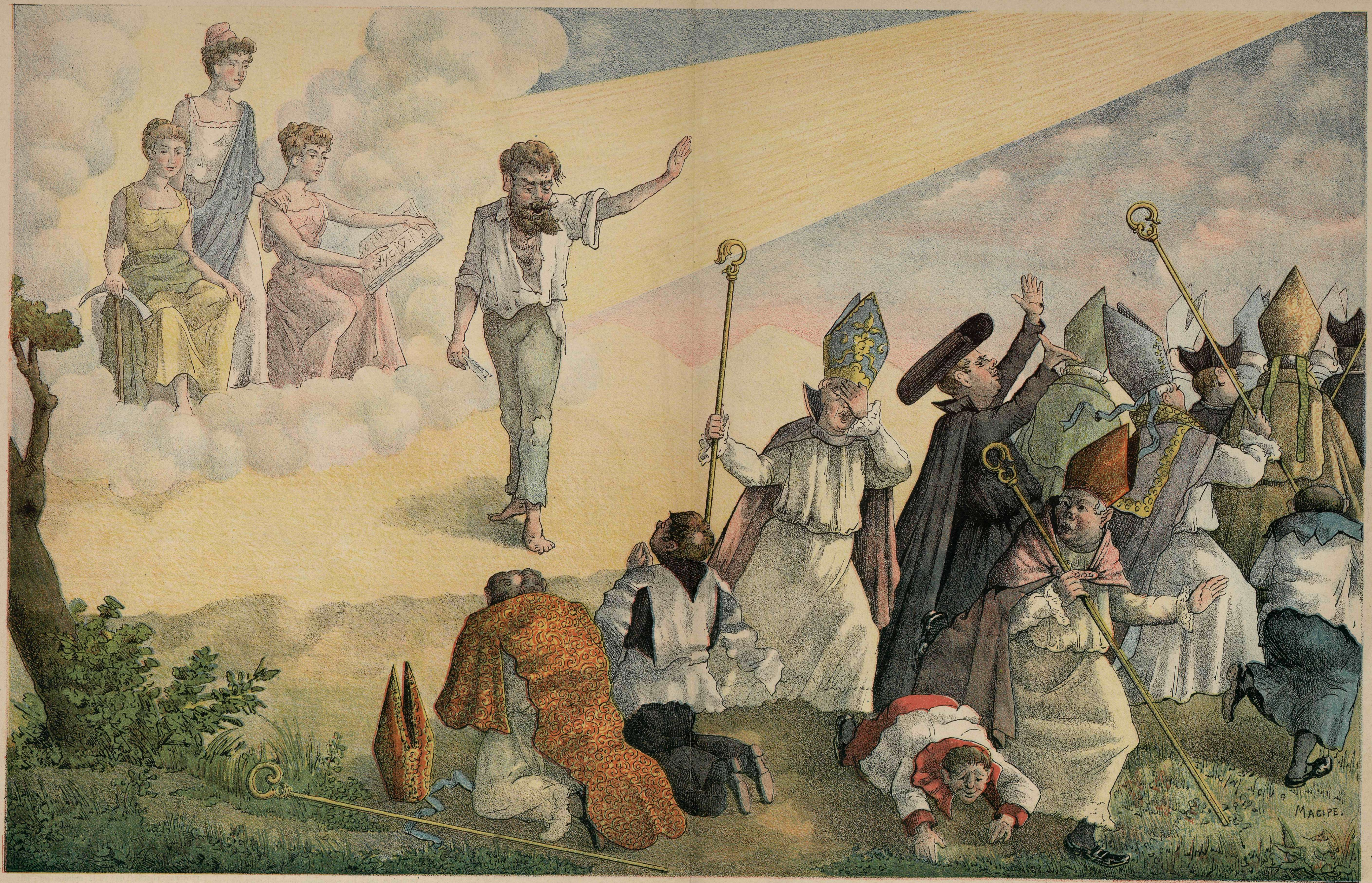
EL MOTIN escomulgando á los que le escomulgan.