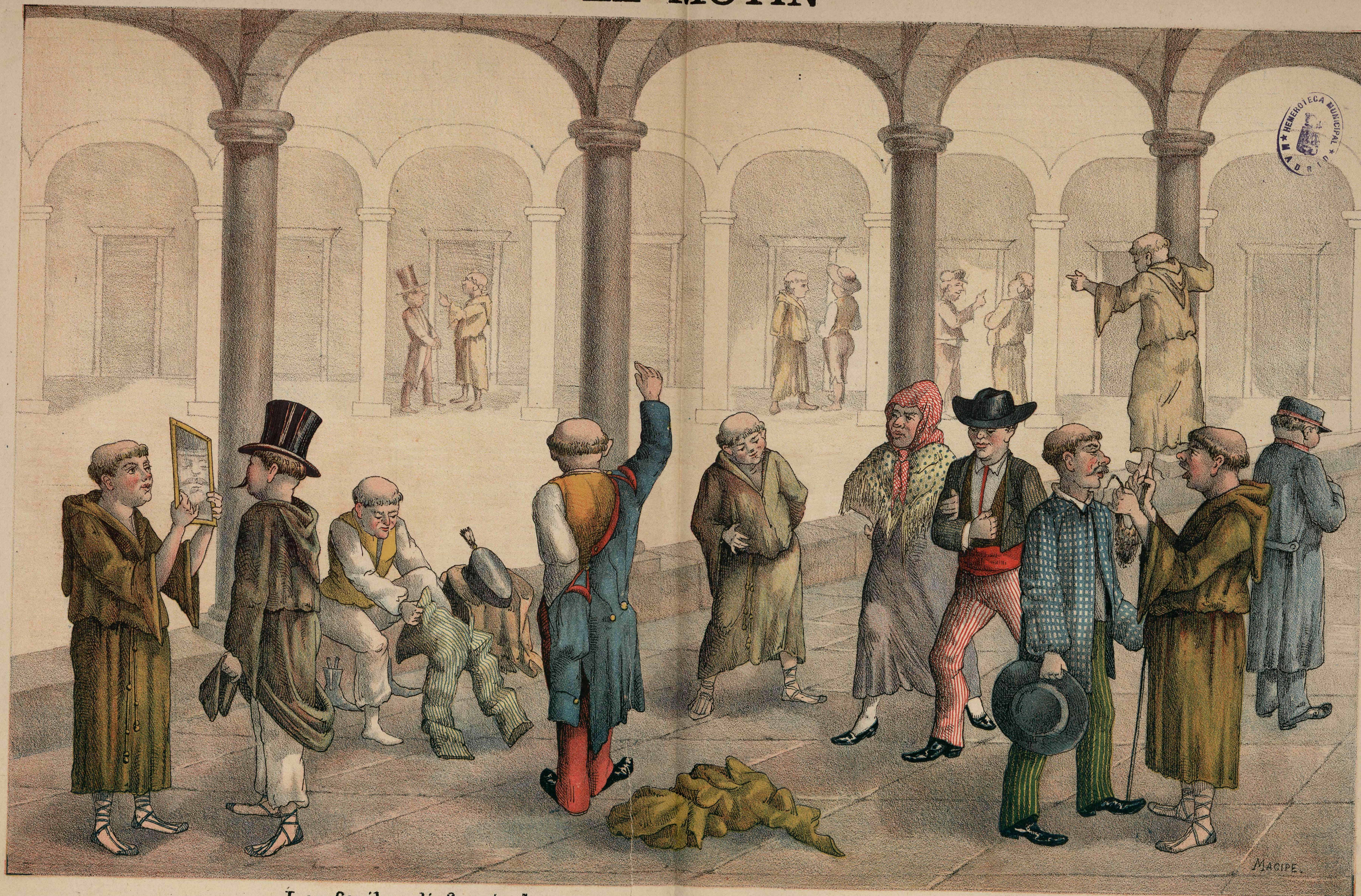
Los frailes disfrazándose para ensayar la tragedia titulada LA FUGA.