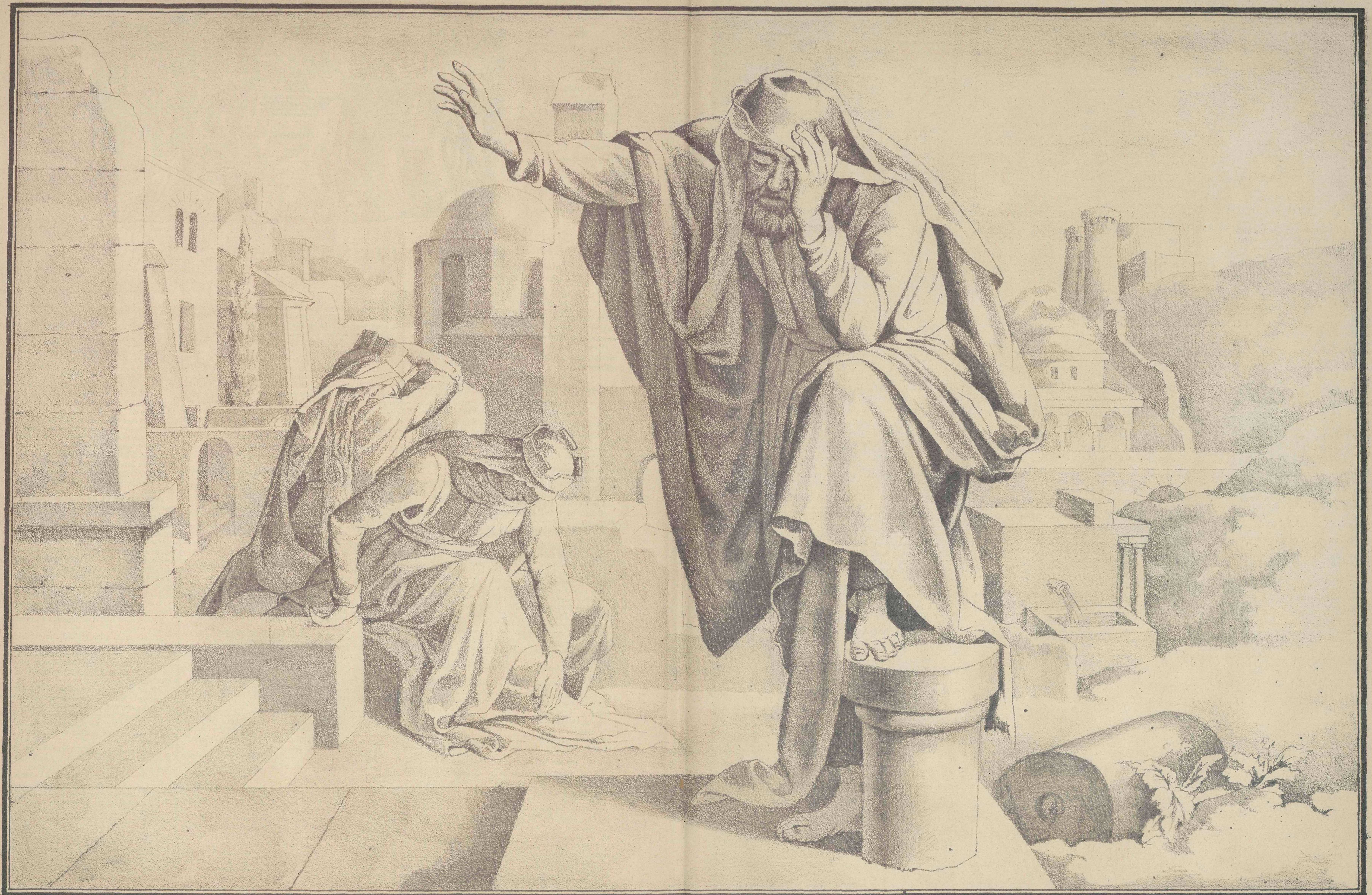
Lamentaciones de Jeremias.