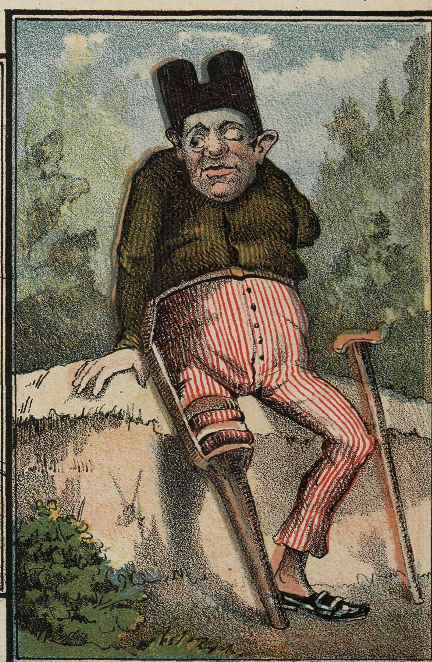
Por predicar la religión á balazos.

Facsimiles de cajas de cerillas. Recuerdos de la ultima guerra civil.