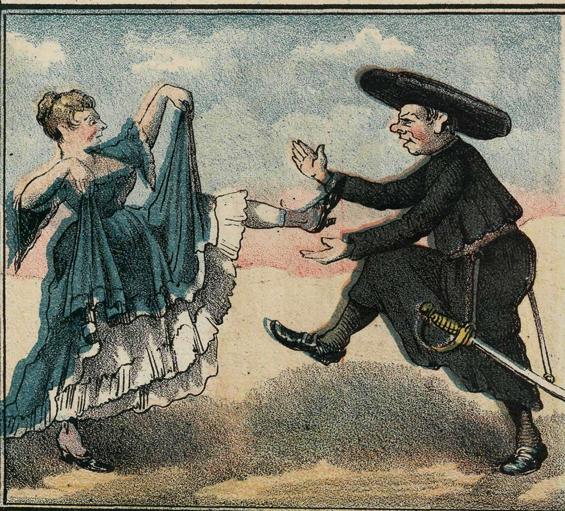
Celebrando los fusilamientos de Olot.