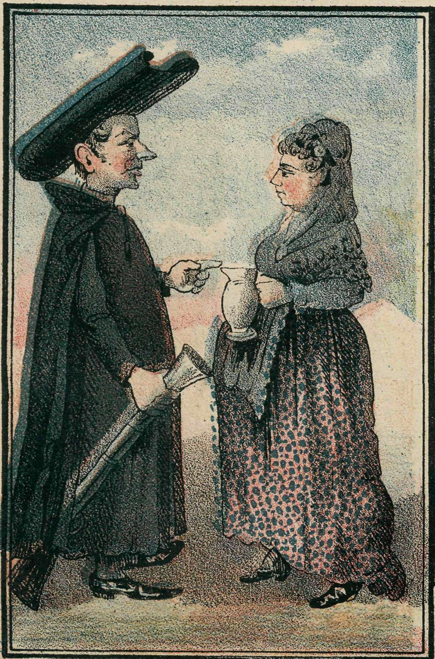
Desocupa y vuelve cuando regrese yo de campaña.