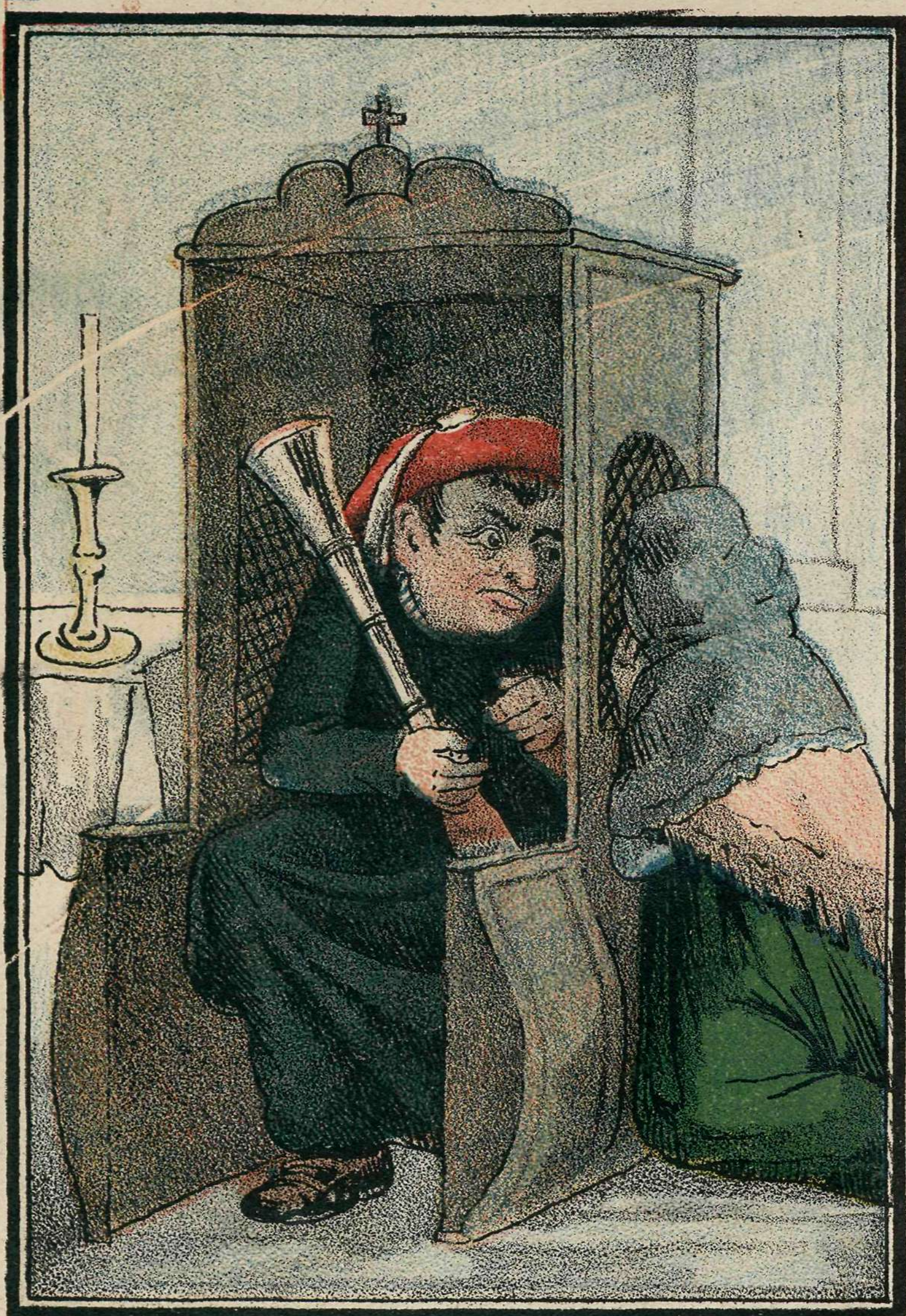
Despache, hermana, que me aguarda la partida.