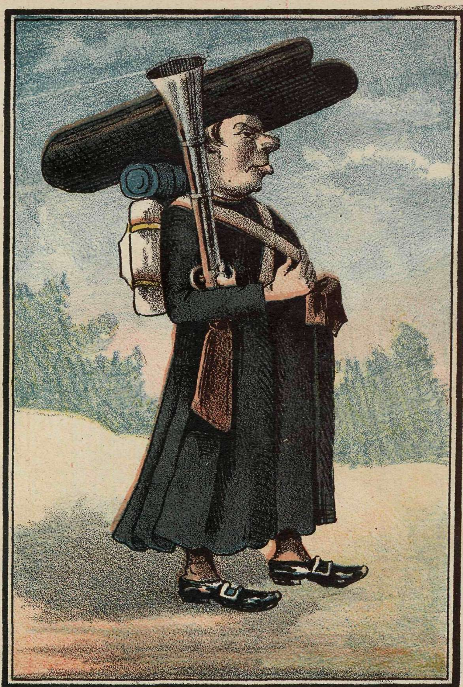
Voluntario de infanteria.