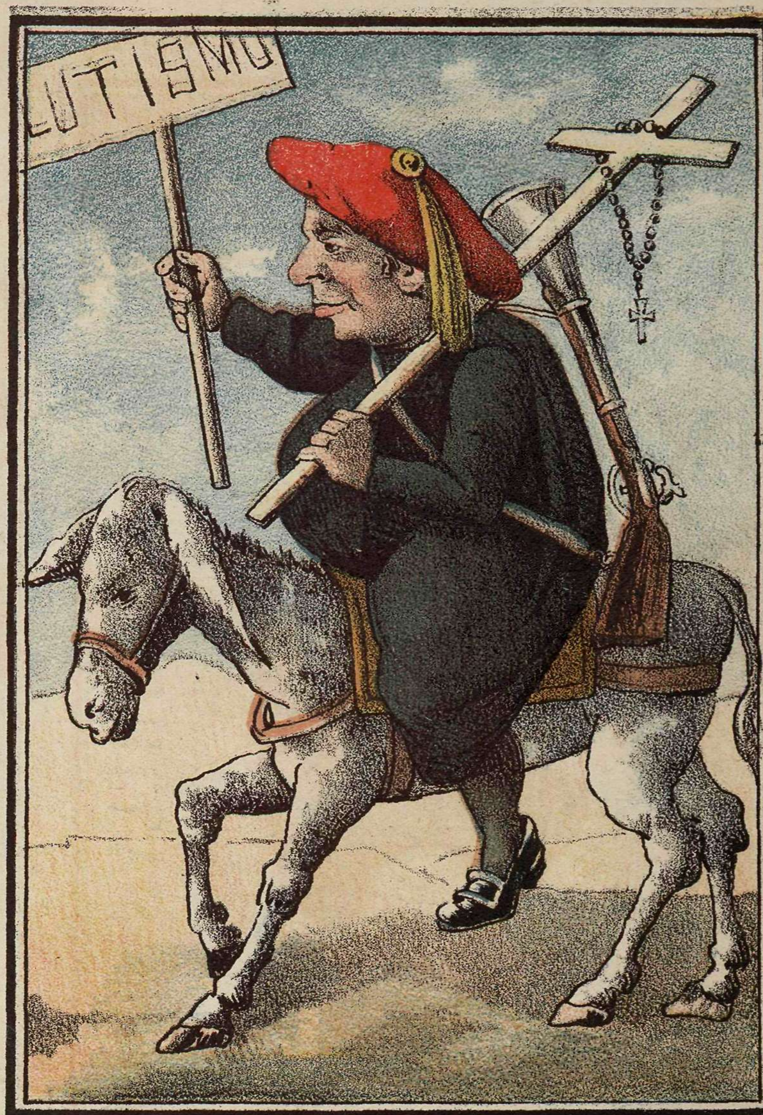
Voluntario de Caballeria.