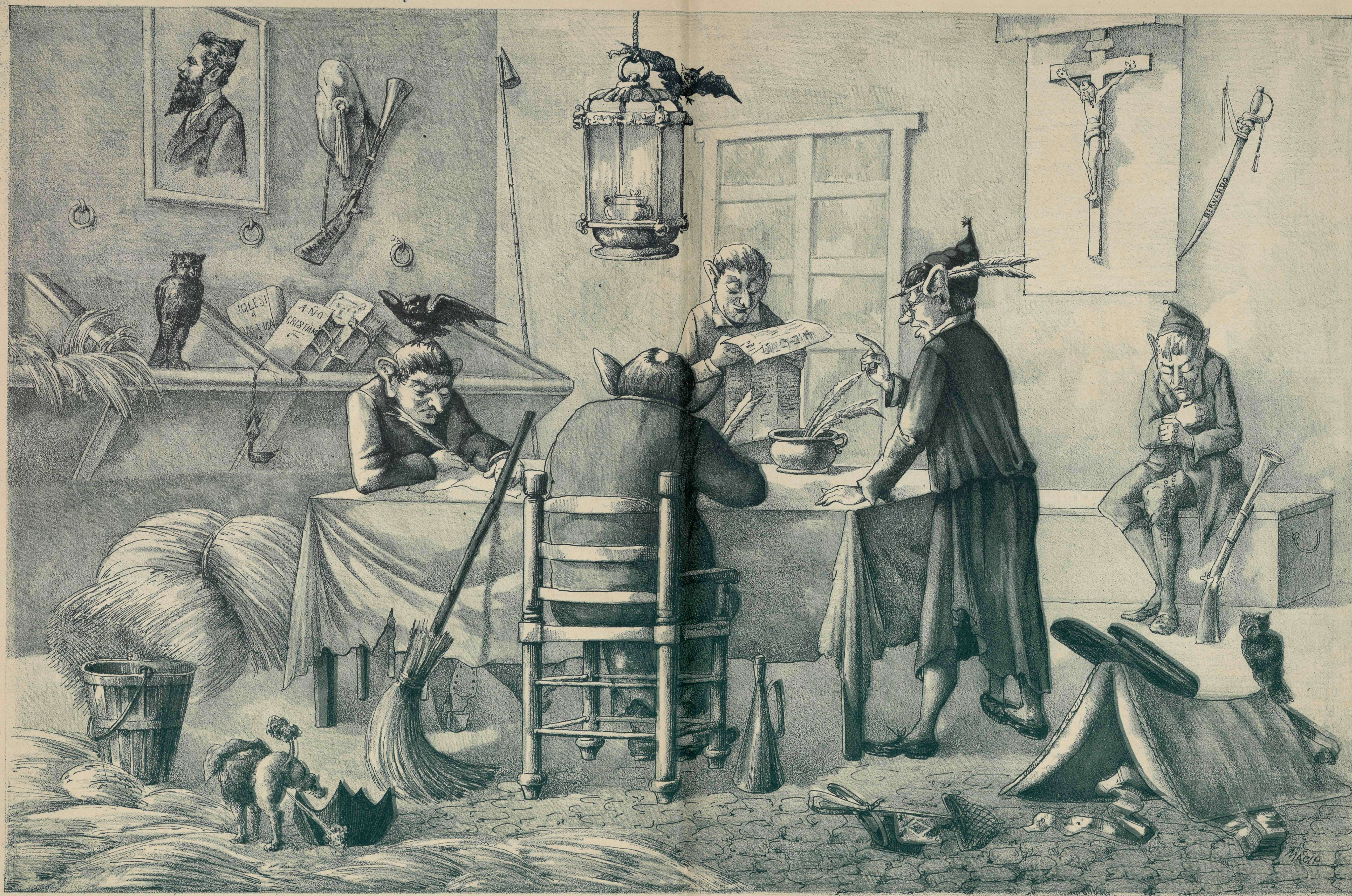
La redaccion de un periódico mestizo.