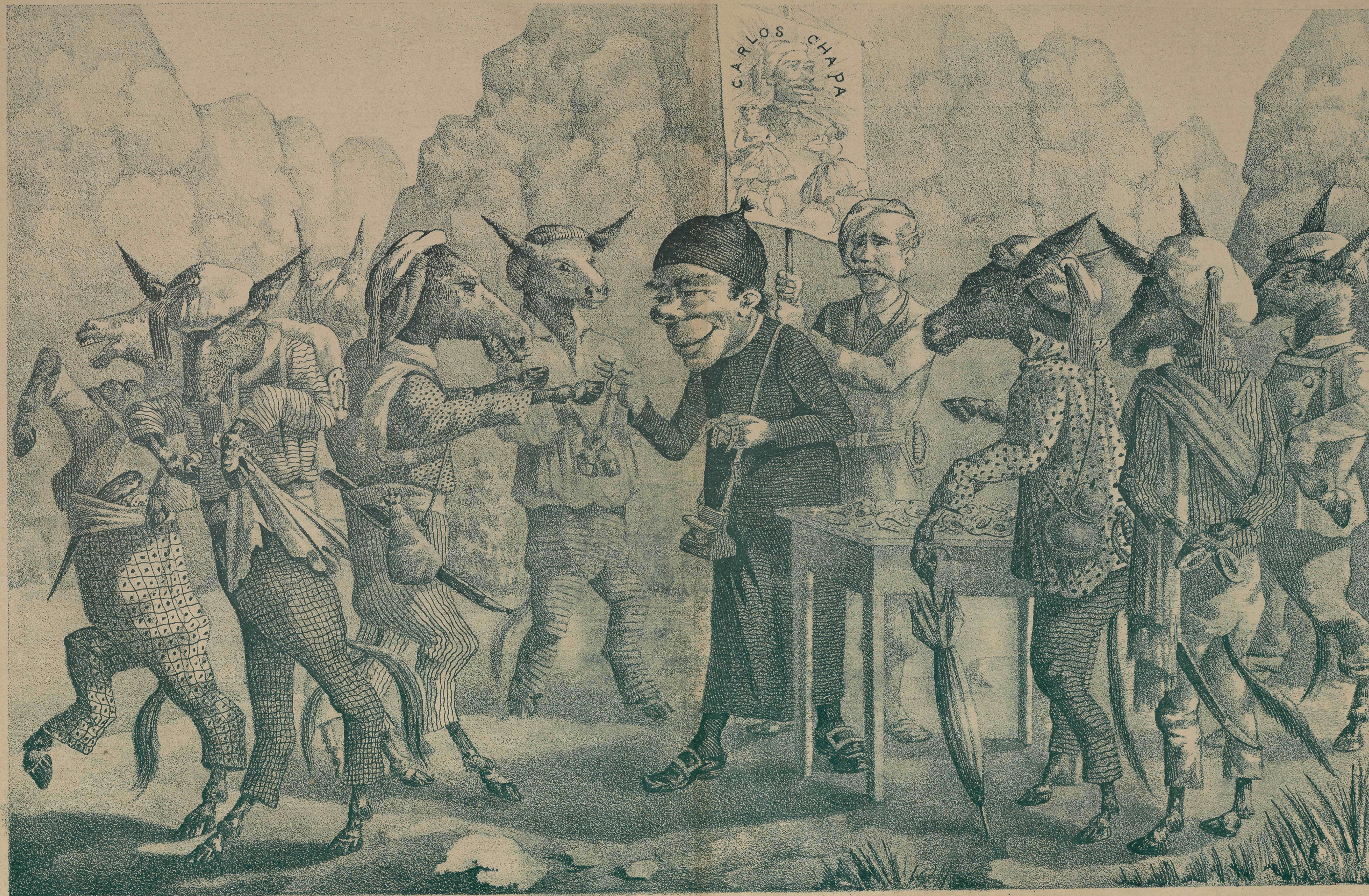
Dos pesetas..... y alpargatas.