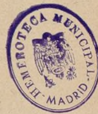
Figurines de men estos días. Ayuntamiento de Madrid