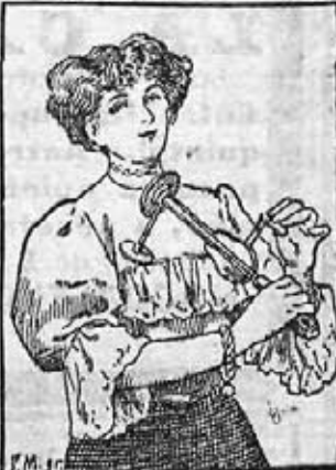
Después de un breve tratamiento con el «VEEDEE» se respira libremente.