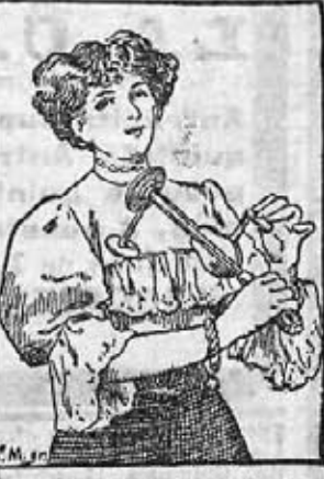
Después de un breve tratamiento con el «VEEDEE» se respira libremente.