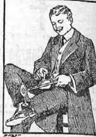
El dolor desaparece en pocos segundos con el uso del «VEEDEE»