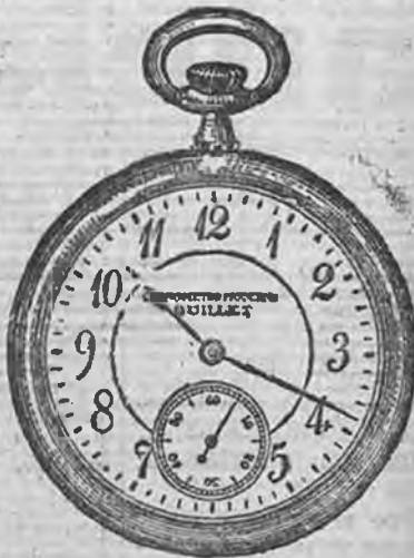
N.º 1.—SIN TAPA

Va acompañado de un Botellín de Marcha y de Registro, expedido por una de las primeras Manufacturas de Relojería del mundo. Está garantizado por 5 años y su precisión es absoluta.