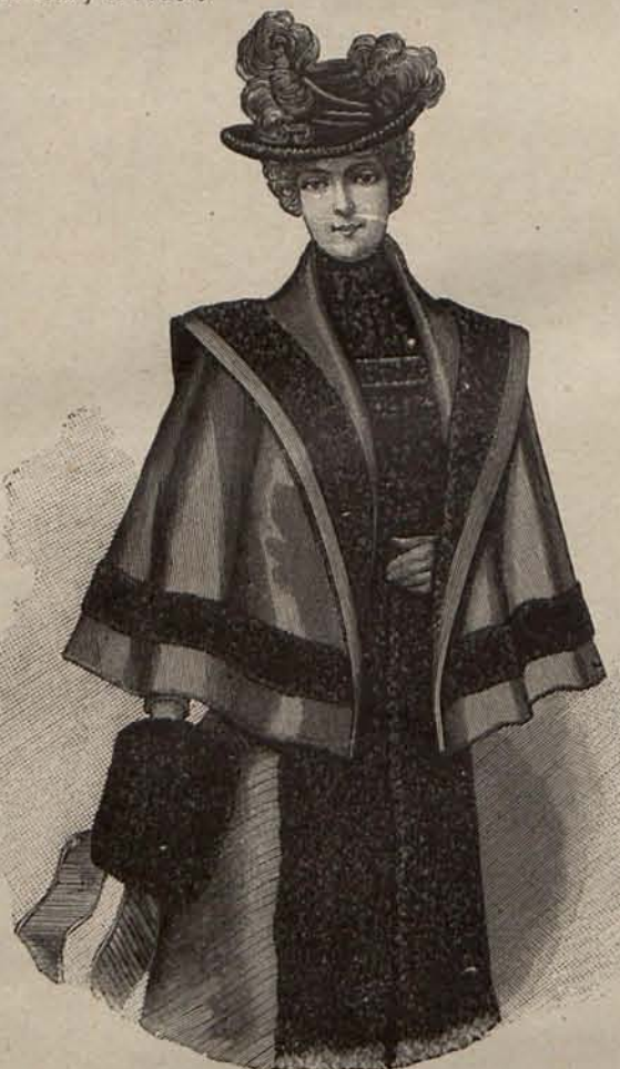
Núm. 8.—Esclavina novedad. (Delantero.)

bucles. Un círculo Diana, de oro y pedrería, sostiene la parte inferior del rodete; y dos grupos de rizos poco acentuados, adornan la frente y el espacio que media en- tre ésta y el rodete.