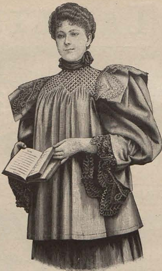
Núm. 2.—Matinée blusa.

Y no es una figura retórica la que empleo, porque precisamente este año es mayor que en los anteriores