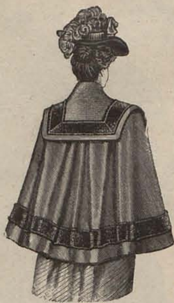
Núm. 7.—Esclavina novedad. (Espalda.)

bucles. Un círculo Diana, de oro y pedrería, sostiene la parte inferior del rodete; y dos grupos de rizos poco acentuados, adornan la frente y el espacio que media en- tre ésta y el rodete.