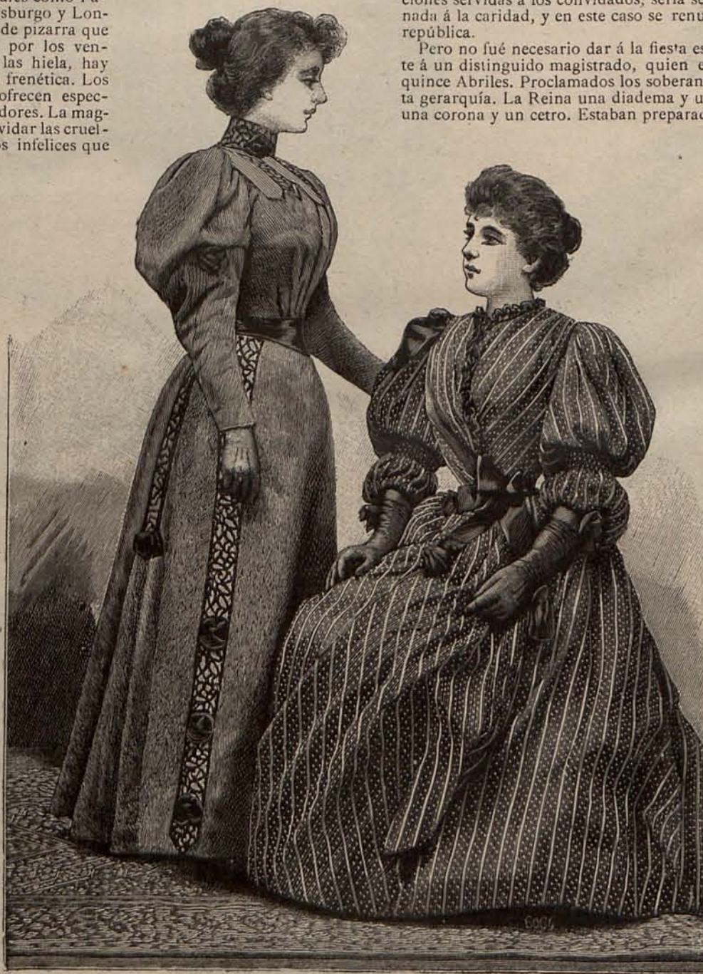
Núm. 3. Trajes para recibir.

la afición á simbolizar las flores en los bailes de disfraces, que también se celebran con más entusiasmo que de costumbre. En efecto, como si se quisiera alargar el breve plazo del imperio del Carnaval, los bailes de máscara sin careta, se suceden con frecuencia en los más distinguidos hoteles de París. Los bailes públicos siguen en decadencia; pero los particulares en la esfera de la buena sociedad han recuperado en el actual Invierno sus pasados prestigios.